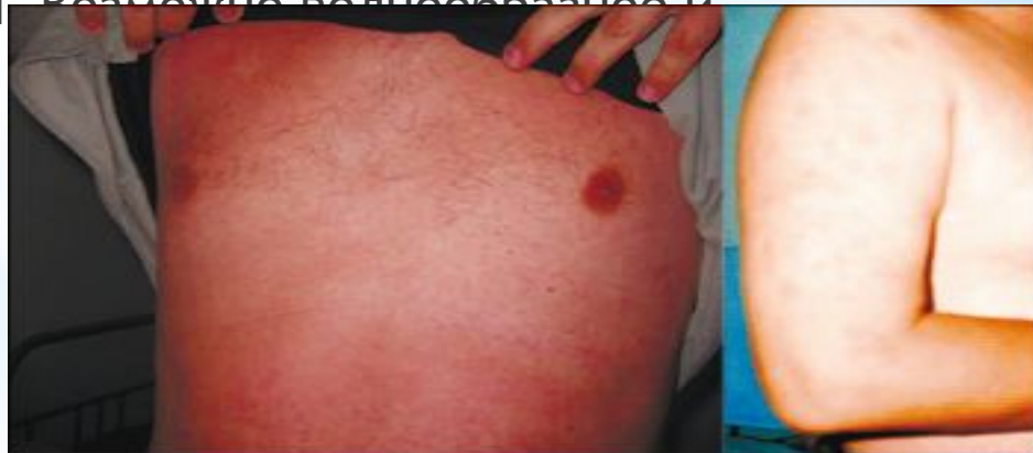
Рис. 1. Иерсиниоз, первично-генерализованная форма ( Y. kristensenii ). Генерализованная мелкопятнистая и крупнопятнистая сыпь (собственное наблюдение)