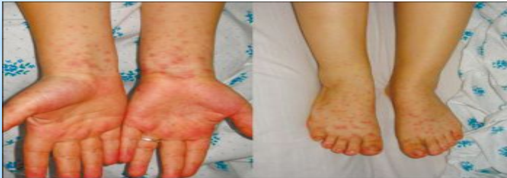
Рис. 3. Иерсиниоз, первично-генерализованная форма. Сгущение сыпи в дистальном отделе верхних конечностей (симптом «перчаток»), нижних конечностей (симптом «носков») (собственное наблюдение)