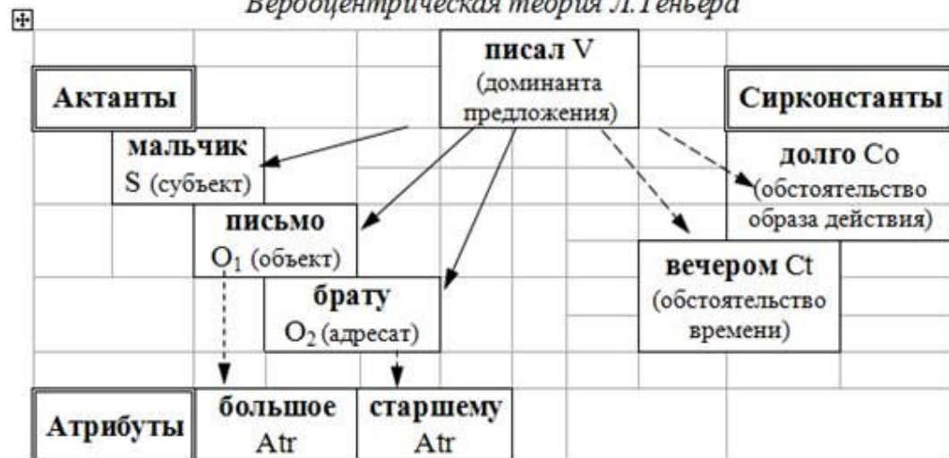
Вербоцентрическая теория Л.Теньера