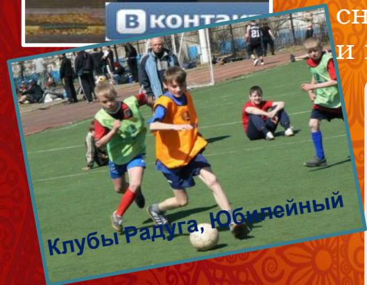
Клубы Радуга, Юбилейный