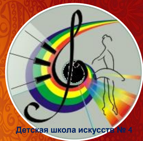
Детская школа искусств № 4