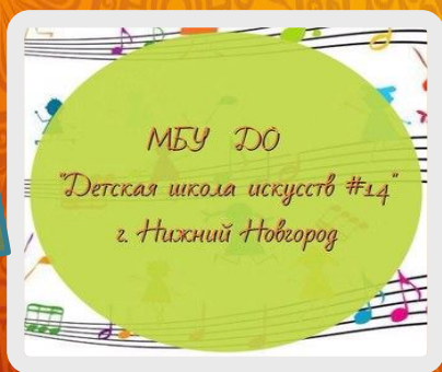
МБУ ДО "Детская школа искусств №14" г. Нижний Новгород