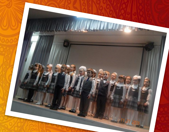
Уровень удовлетворенности качеством платных образовательных услуг гимназии