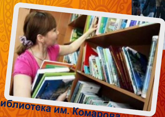
Библиотека им. Комарова