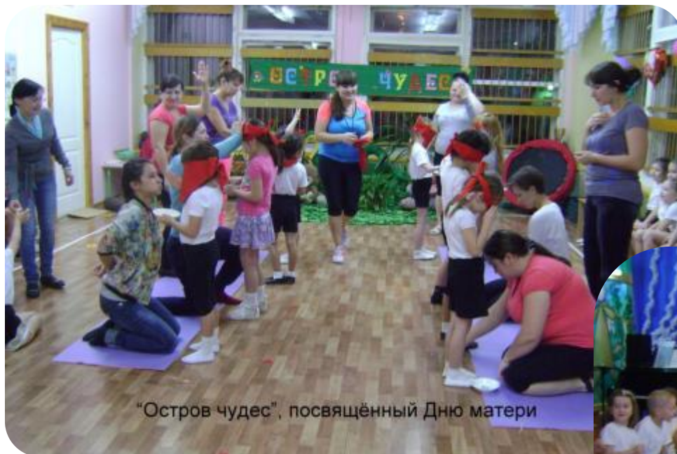
«Остров чудес», посвящённый Дню матери