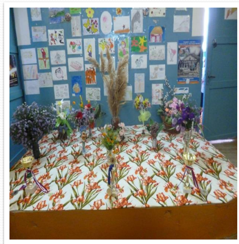
ставка цветов «Осенний букет».