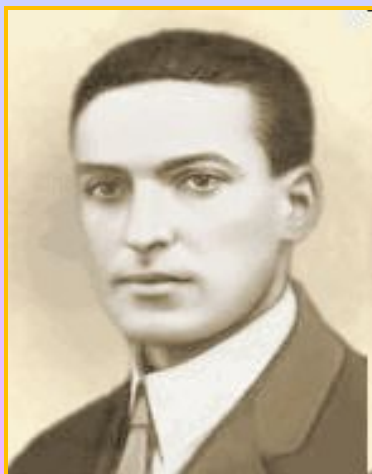
Выготский Л. С.