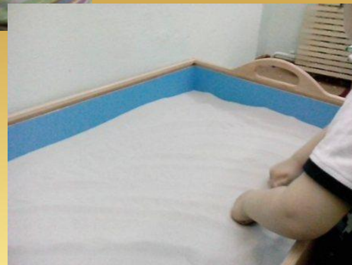
Игра "Идут медвежата"