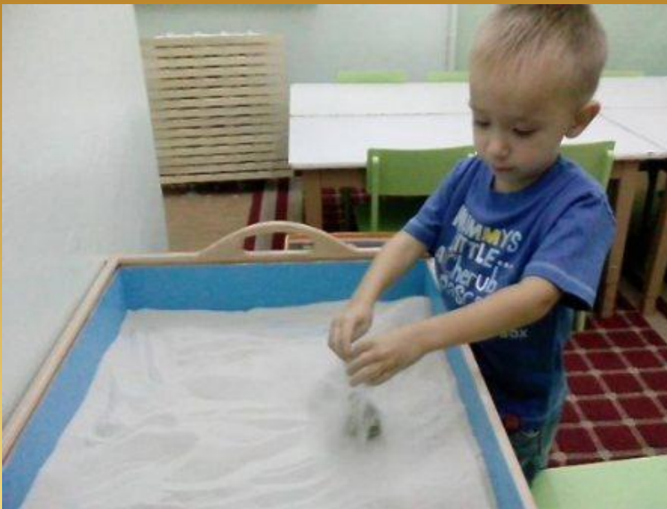
Игра «Спрячь игрушку»