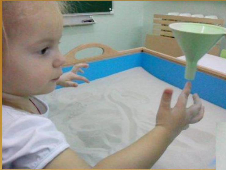
Игра «Здравствуй песок!»