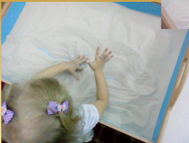
Игра "Поехали как машинки"