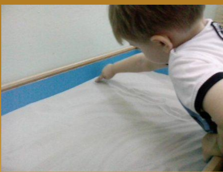
Игра "Дорожка для мышки"