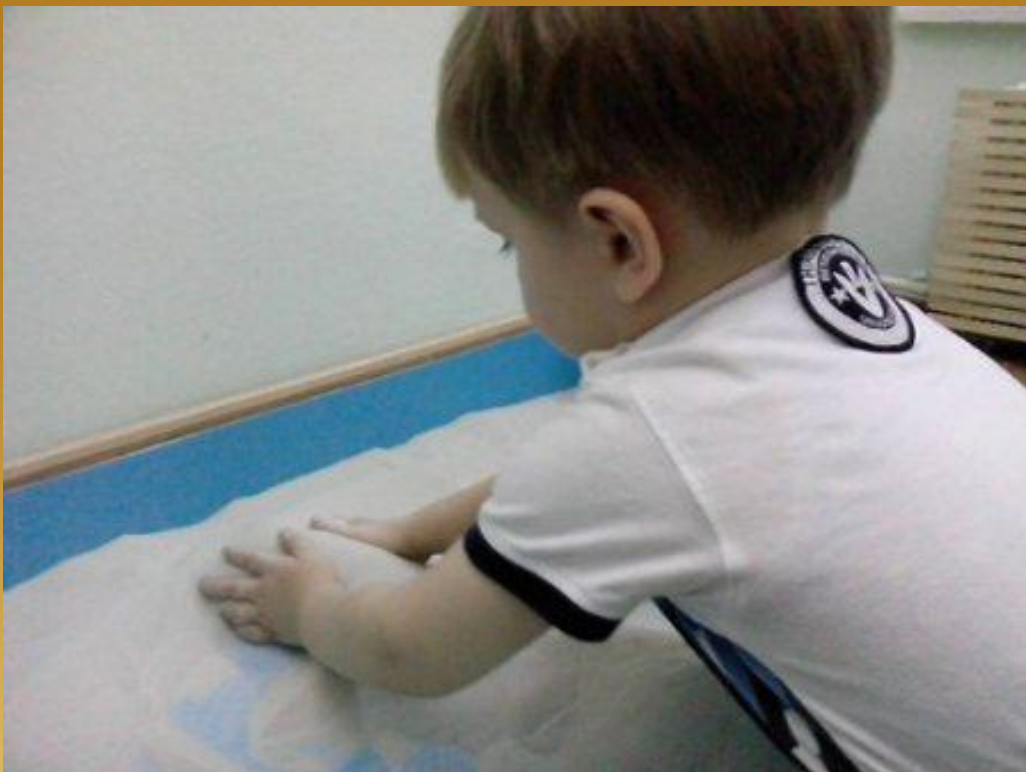
Игра «Детские секретики»