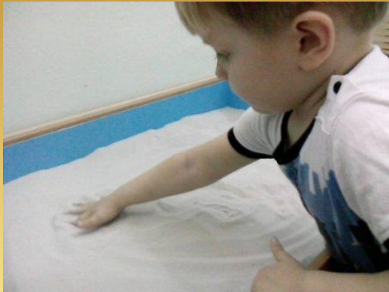
Упражнение "Скользим по поверхности песка, выполняя круговые движения"