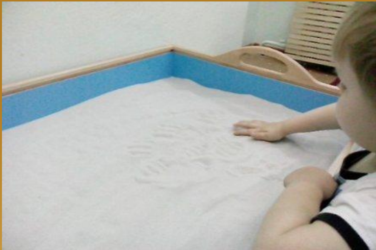
Игра "Отпечатки наших ручек"