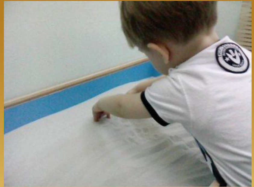
Игра "Прыгают зайки"