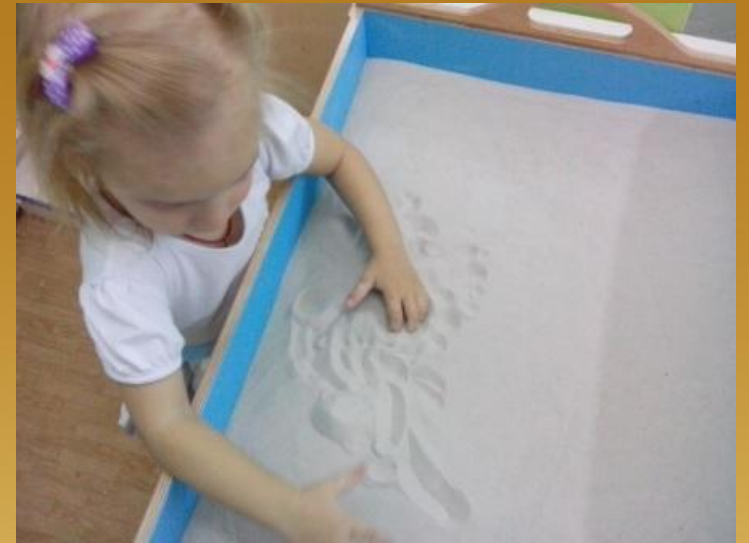
Игра «Необыкновенные следы»