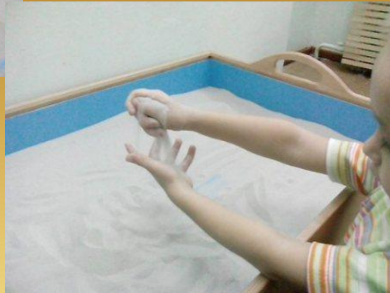
Игра «Песочный дождик»