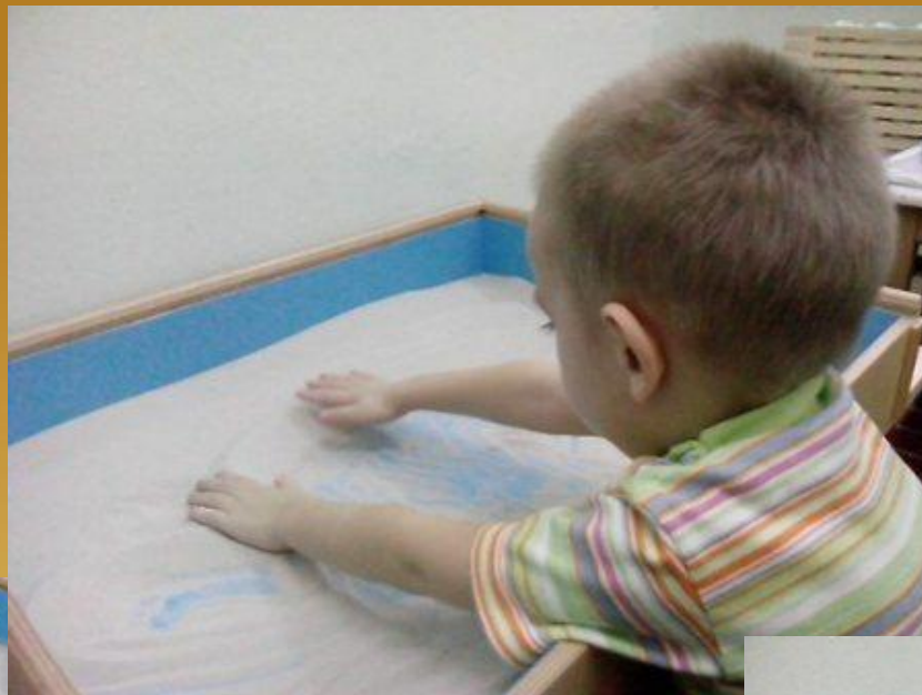
Упражнение "Скользим ладонями по поверхности песка"