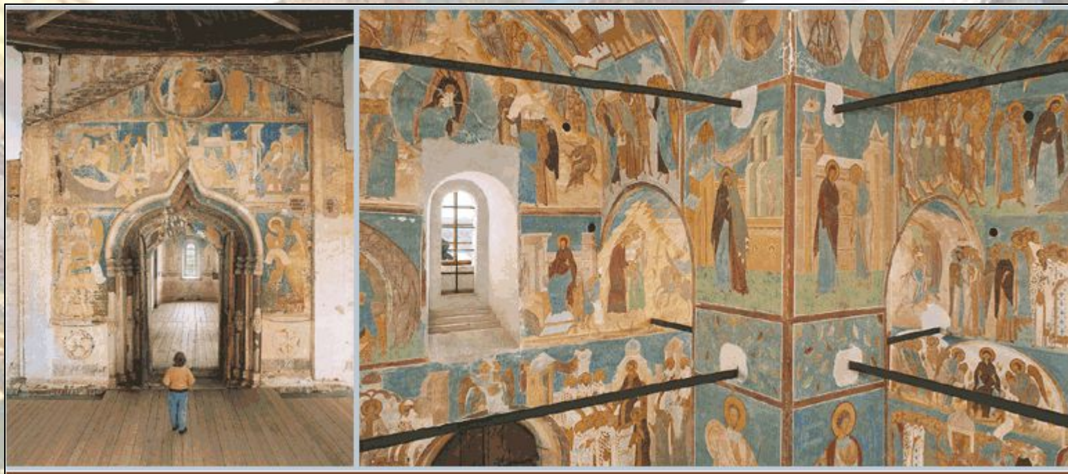
Фрески храма Рождества Богородицы Феропонтова монастыря.

Все стены центральной части храма имеют свои сложившиеся каноны росписей. Наиболее часто росписи храма показывают события из Священной Истории Ветхого и Нового Завета. Композиции размещаются в верхней части основного пространства в определенных рядах (от трех до пяти) и несут важный догматический и учительный характер. Это: " Праздники " (Рождество, Крещение, Благовещение и др.), композиции из жития Богоматери, святых и др. Если храм посвящен Богоматери, то большинство росписей изображают житие Пресвятой Богородицы.