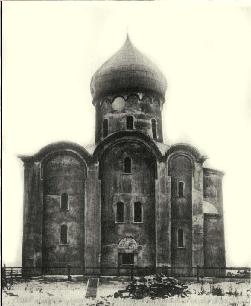
Храм Спаса Нередицы. XII век.