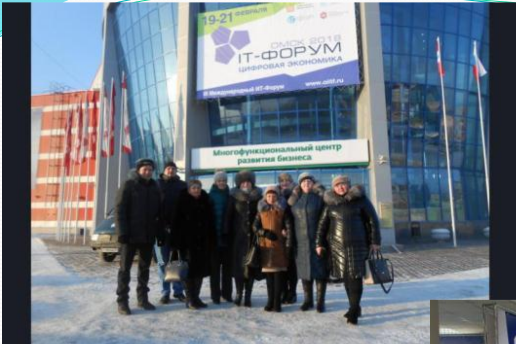
Круглый стол по проблемам дошкольного образования