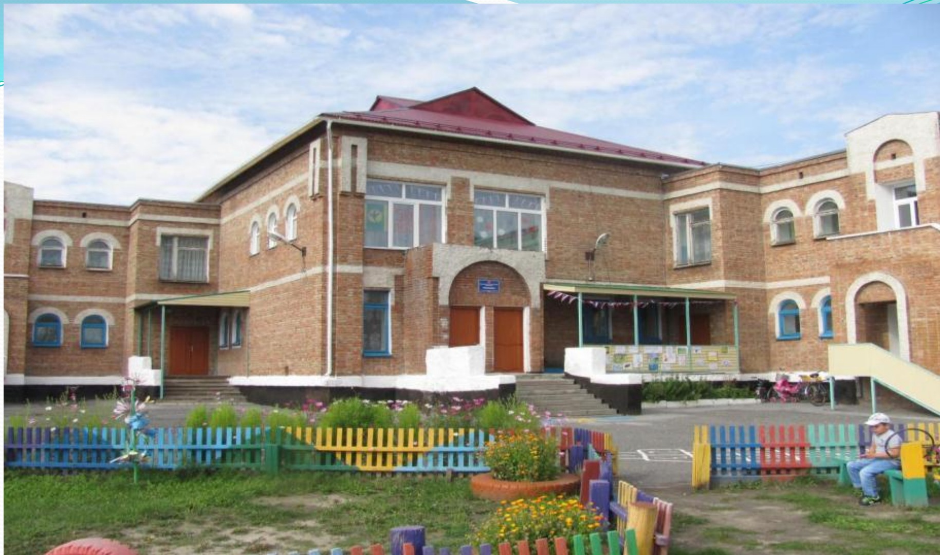
Муниципальное казенное дошкольное образовательное учреждение Баганский детский сад №2 «Солнышко»