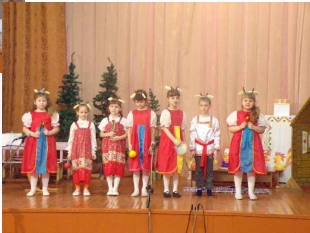
«Волк и семеро козлят»