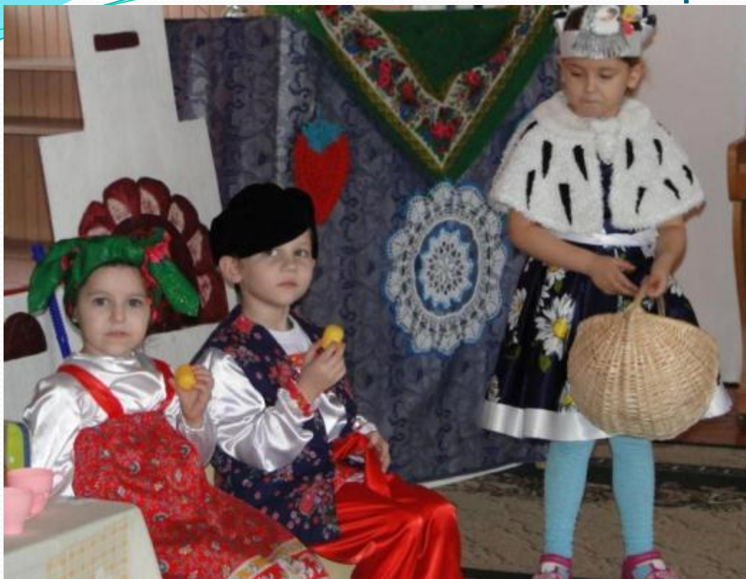
Инсценировки русских народных сказок: «Курочка ряба», «Заюшкина избушка».