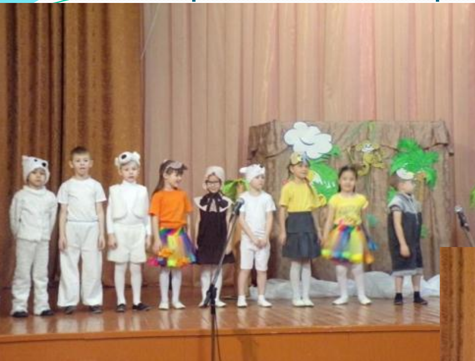
«Мама для мамонтенка»