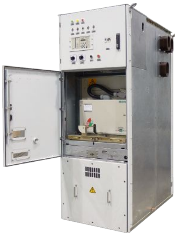
Комплектное распределительное устройство серии КСВ