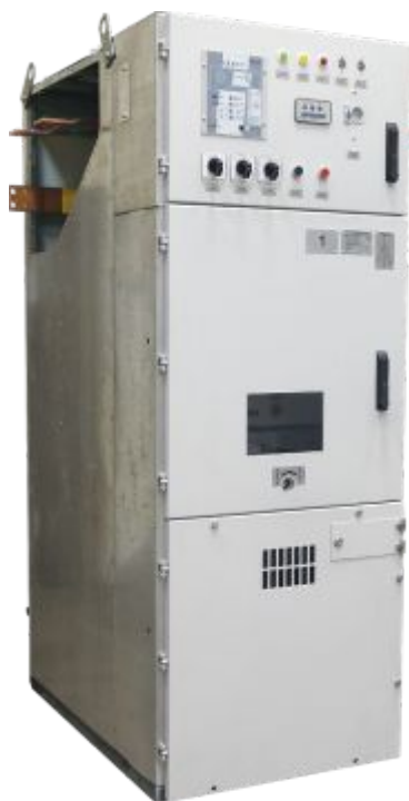
Комплектное распределительное устройство серии КСВ