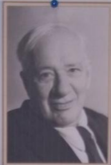
Корней Иванович Чуковский