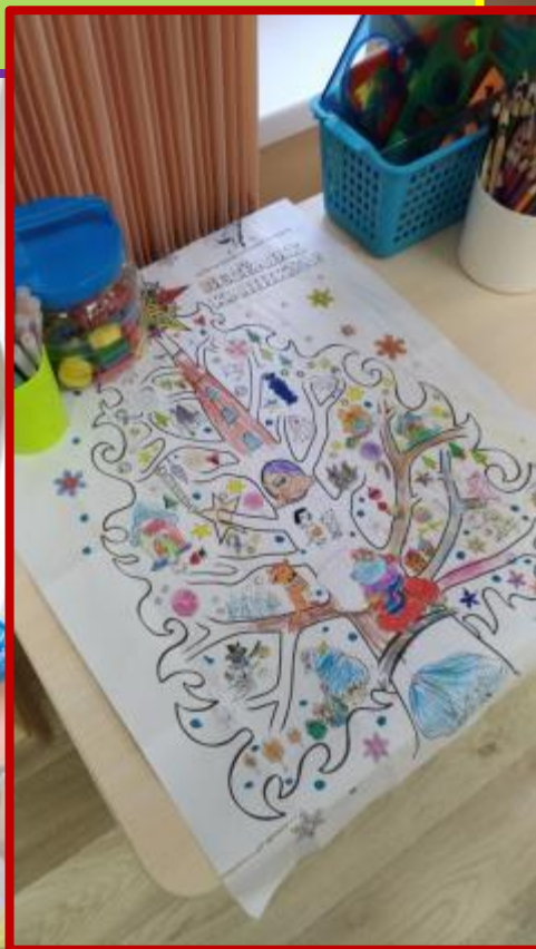
«Зима. Новогоднее чудо»