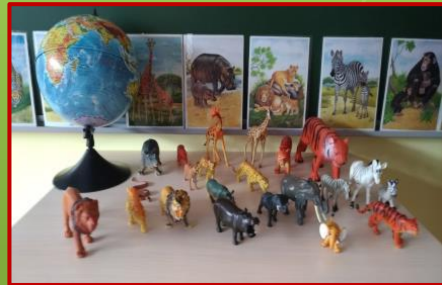
«Животные жарких стран»