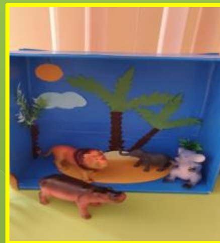
«Животные жарких стран»