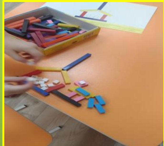
«Зимующие птицы. Кормушка»