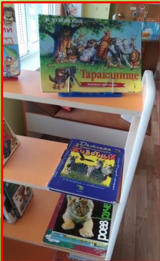
«Животные жарких стран»