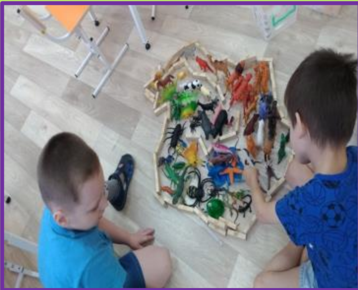
«Животные жарких стран»

Центр конструирования Выполняем постройки по теме недели