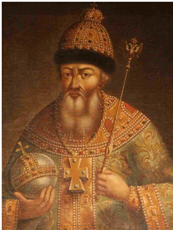
Василий Шуйский (1606 - 1610)