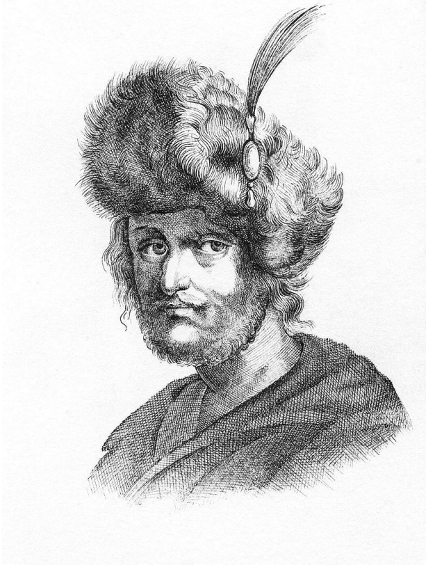
Лжедмитрий II Предполагаемый портрет