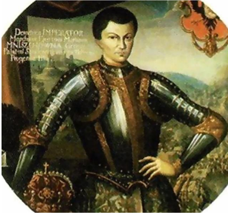
Лжедмитрий I (1605 - 1606)

1604 г. – Лжедмитрий со своим войском перешел российскую границу.