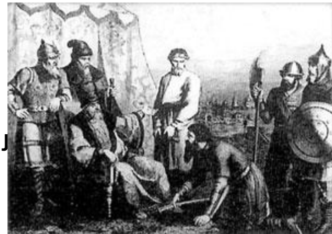
И. И. Болотников является с повинной перед царём Василием Шуйским. Неизвестный художник