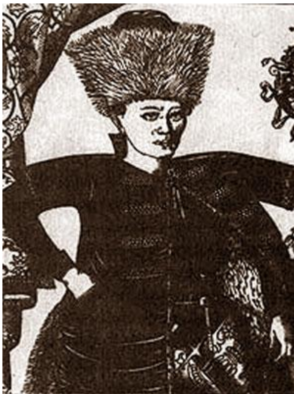
Лжедмитрий I Гравюра XVII в.