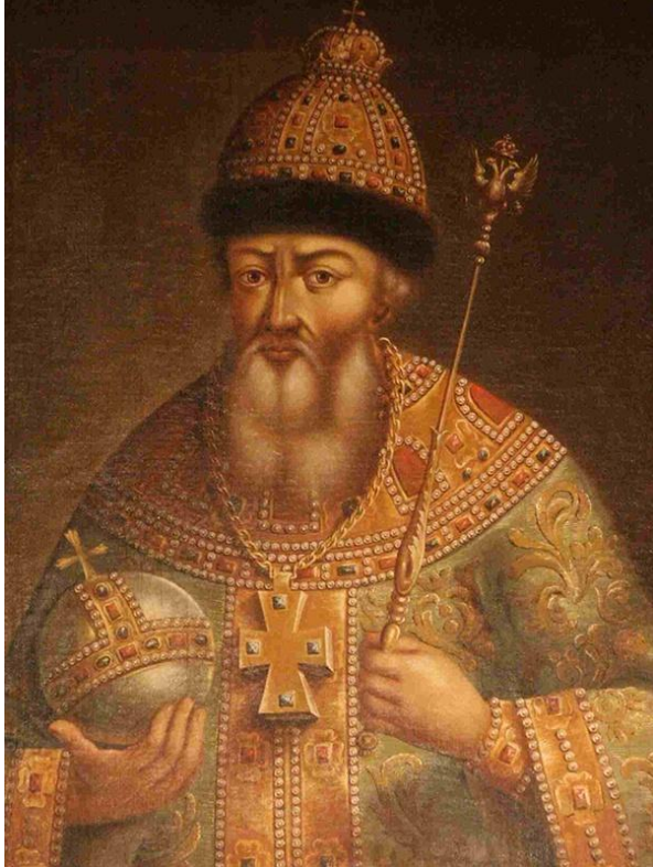
Василий Шуйский (1606 - 1610)