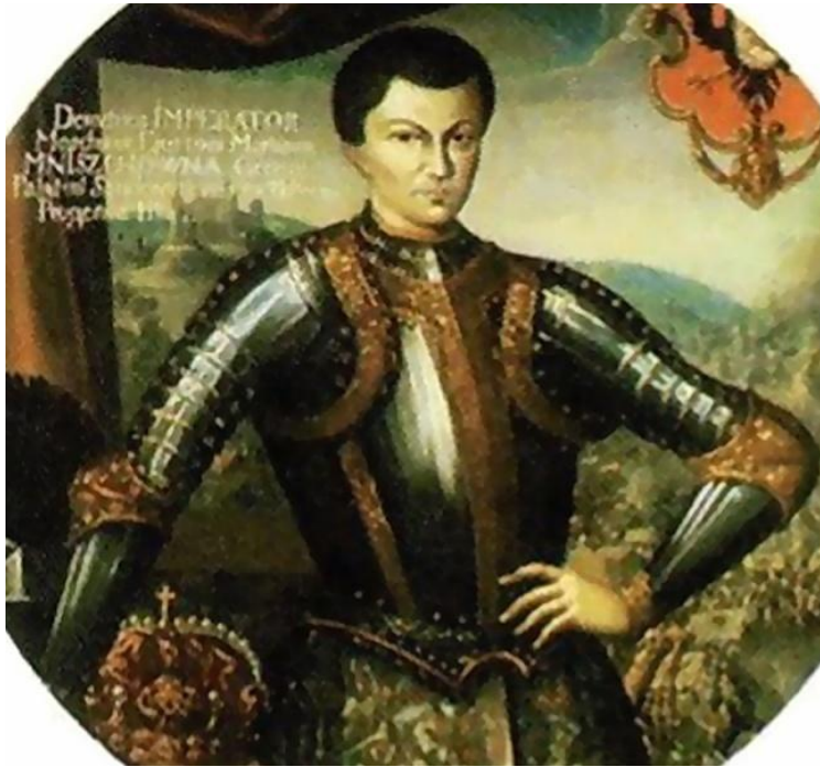
Лжедмитрий I (1605 - 1606)