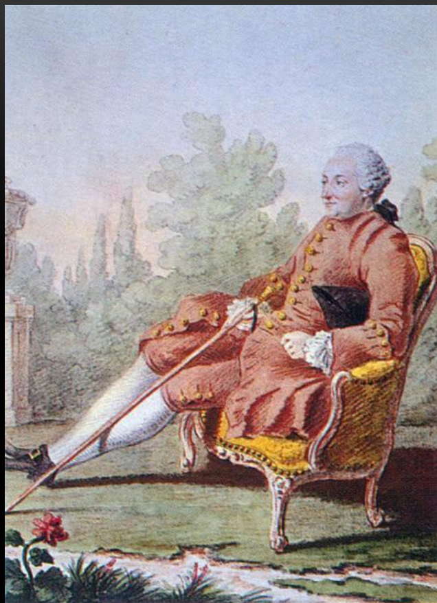
Поль Анри Гольбах