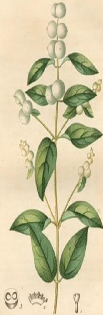
CAMERISIER A GRAPPES