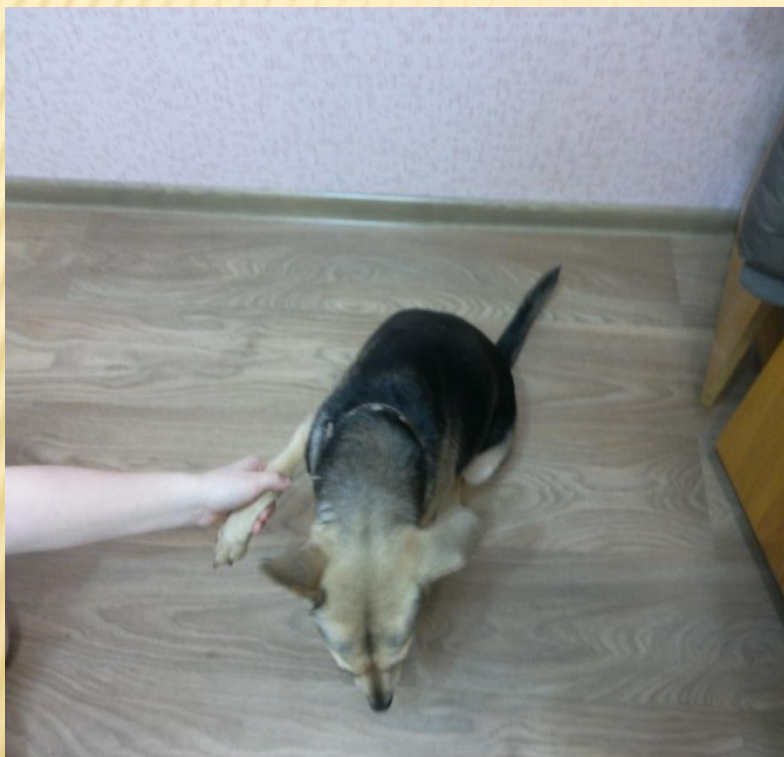
Команда «Дай лапу!»

? Собаки умные животные. Керри знает много команд. Например, «Дай лапу!» и «Сидеть!»