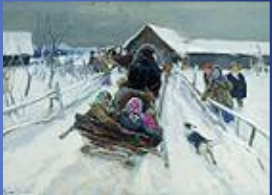
«Катание на Масленицу» (1910 г.)