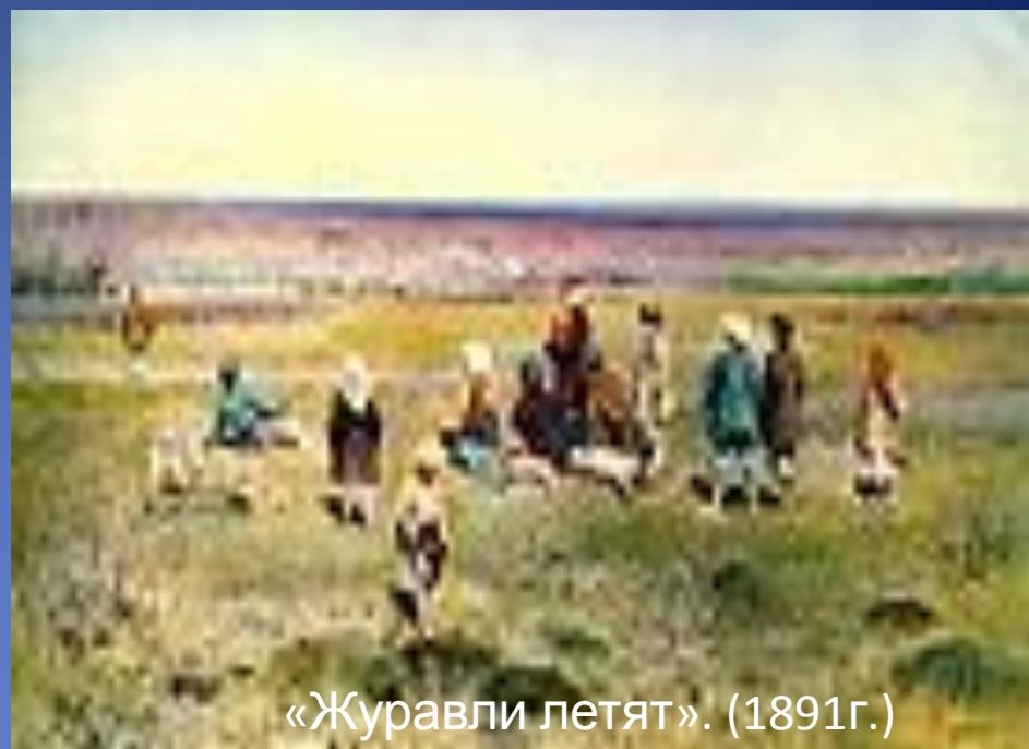
«Журавли летят». (1891г.)