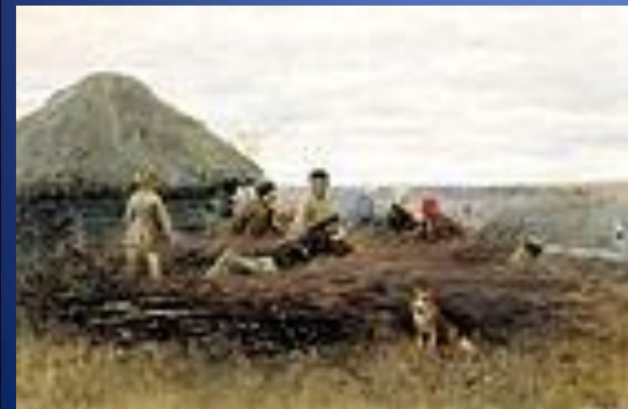
«Дети на хворосте». (1899г.)