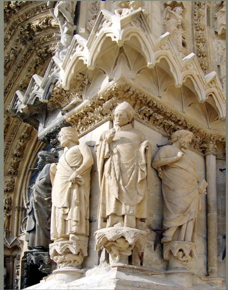
Фрагмент Реймского собора