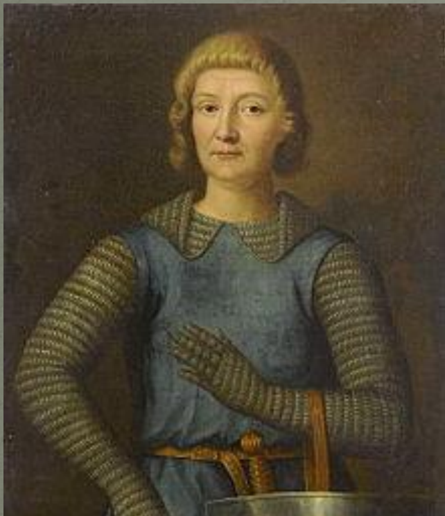
Робер де Куси