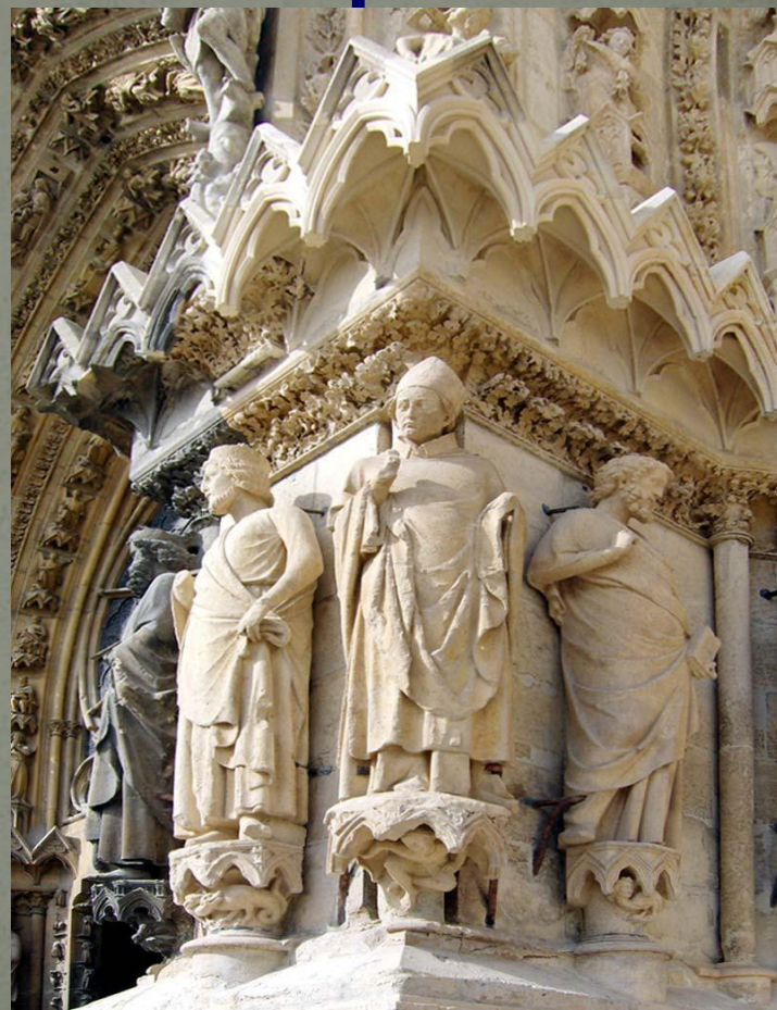
Фрагмент Реймского собора