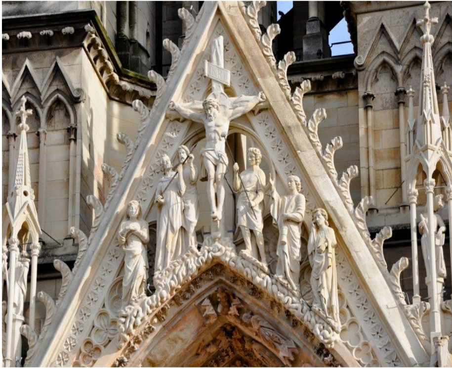
Скульптуры Реймского собора