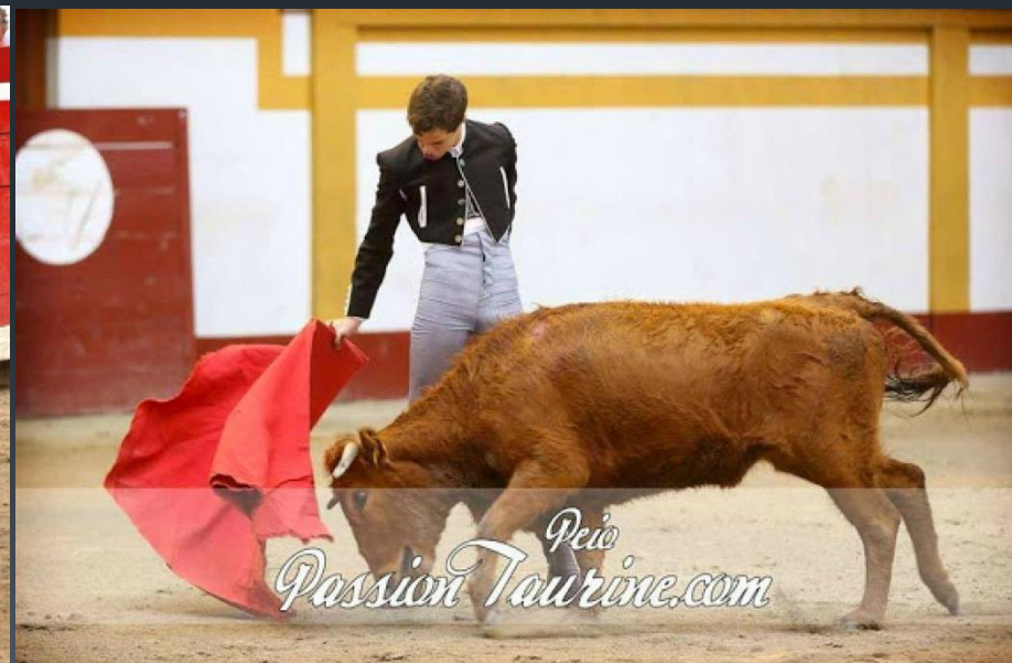
Испытание племенной телки