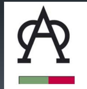
Эмблема, цветовой код и розетка ганадерии Miura