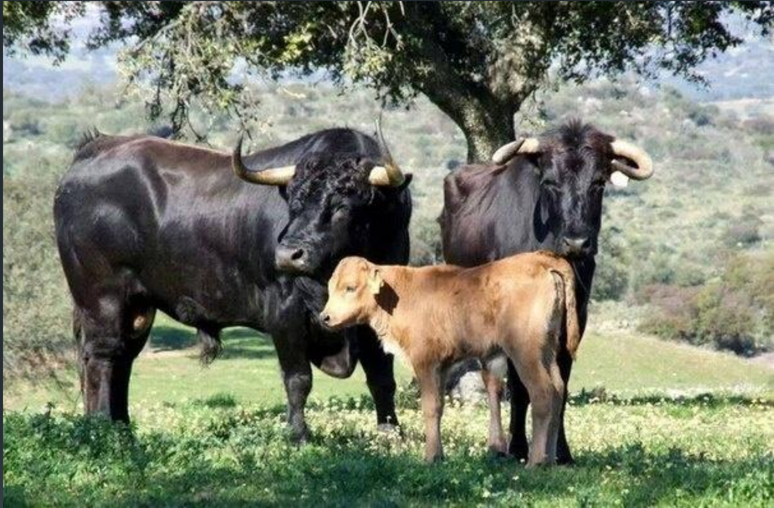
Бык-производитель с коровой и теленком