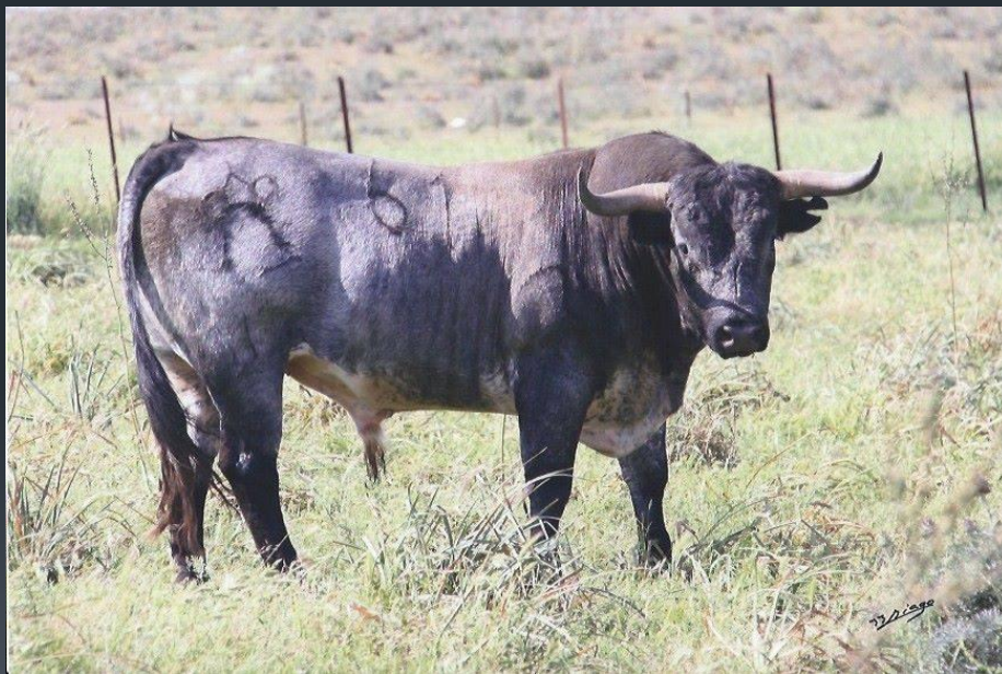
Бык с клеймом ганадерии Миура