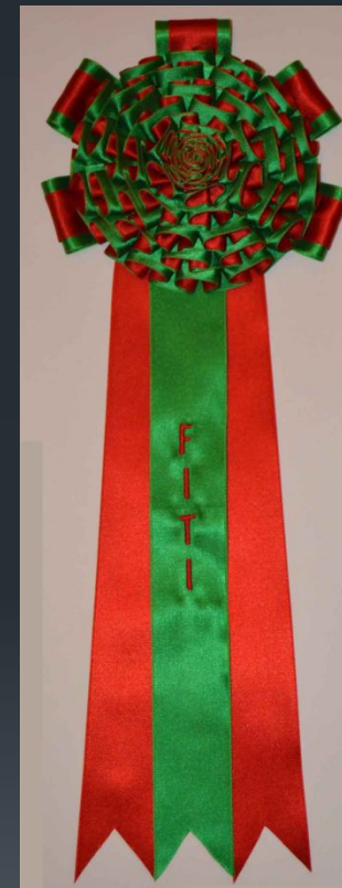
Эмблема, цветовой код и розетка ганадерии Miura