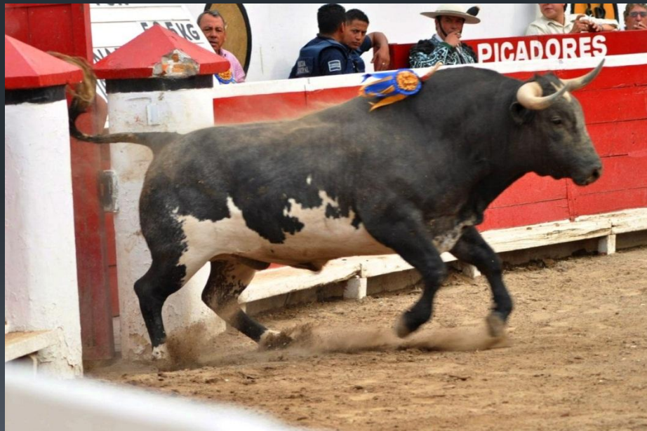
Выход быка на песок