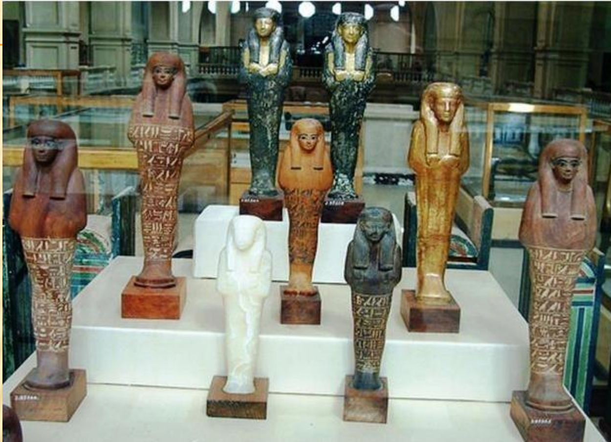
11 статуэток из гробницы фараона