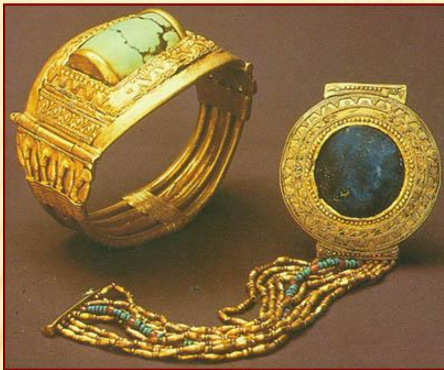
БРАСЛЕТЫ ИЗ ГРОБНИЦЫ ТУТАНХАМОНА