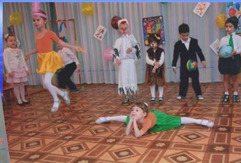
Инсценировка песни. Слова Н.Гриджиной, музыка М. Сулягиной