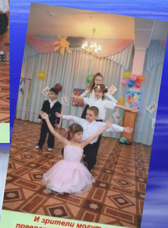
И зрители могут превратиться в артистов!