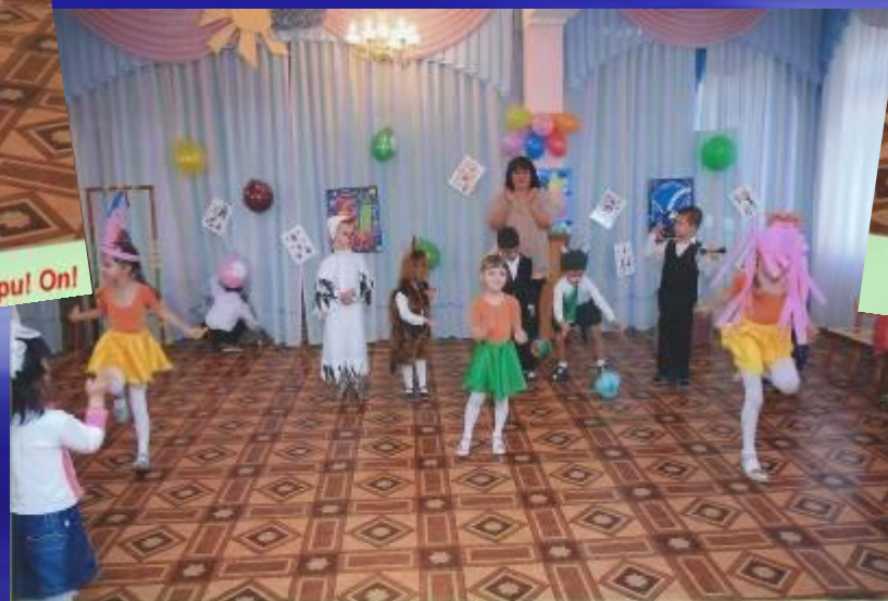
Вот и закончилось цирковое представление...