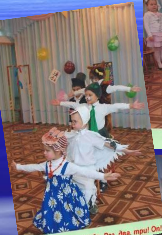
Египетская пирамида. Раз, два, три! Он!