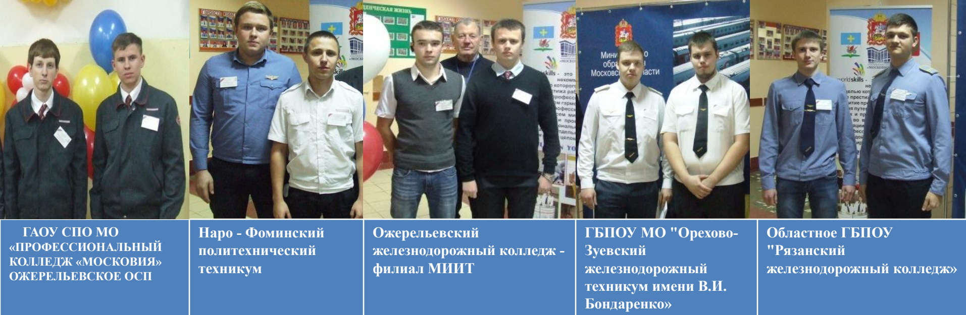
ГАОУ СПО МО «ПРОФЕССИОНАЛЬНЫЙ КОЛЛЕДЖ «МОСКОВИЯ» ОЖЕРЕЛЬЕВСКОЕ ОСП