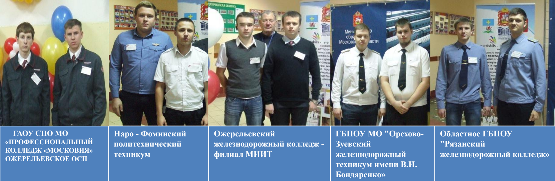
ГАОУ СПО МО «ПРОФЕССИОНАЛЬНЫЙ КОЛЛЕДЖ «МОСКОВИЯ» ОЖЕРЕЛЬЕВСКОЕ ОСП