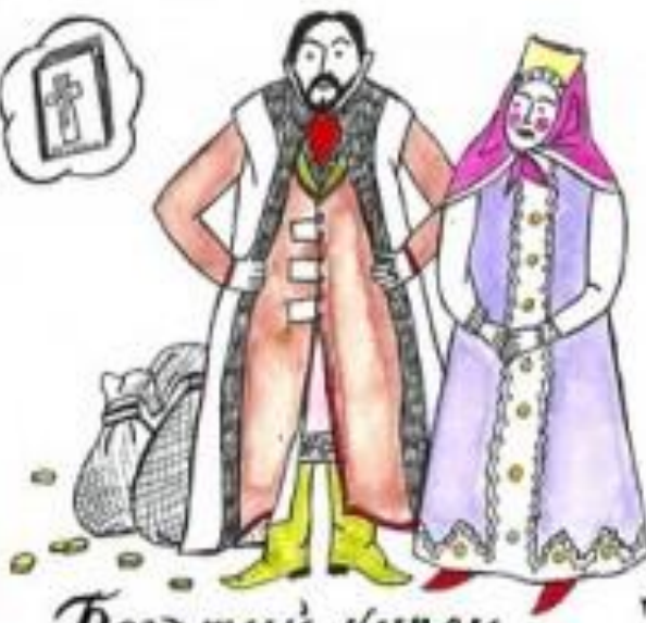
Богатый купец и его жена