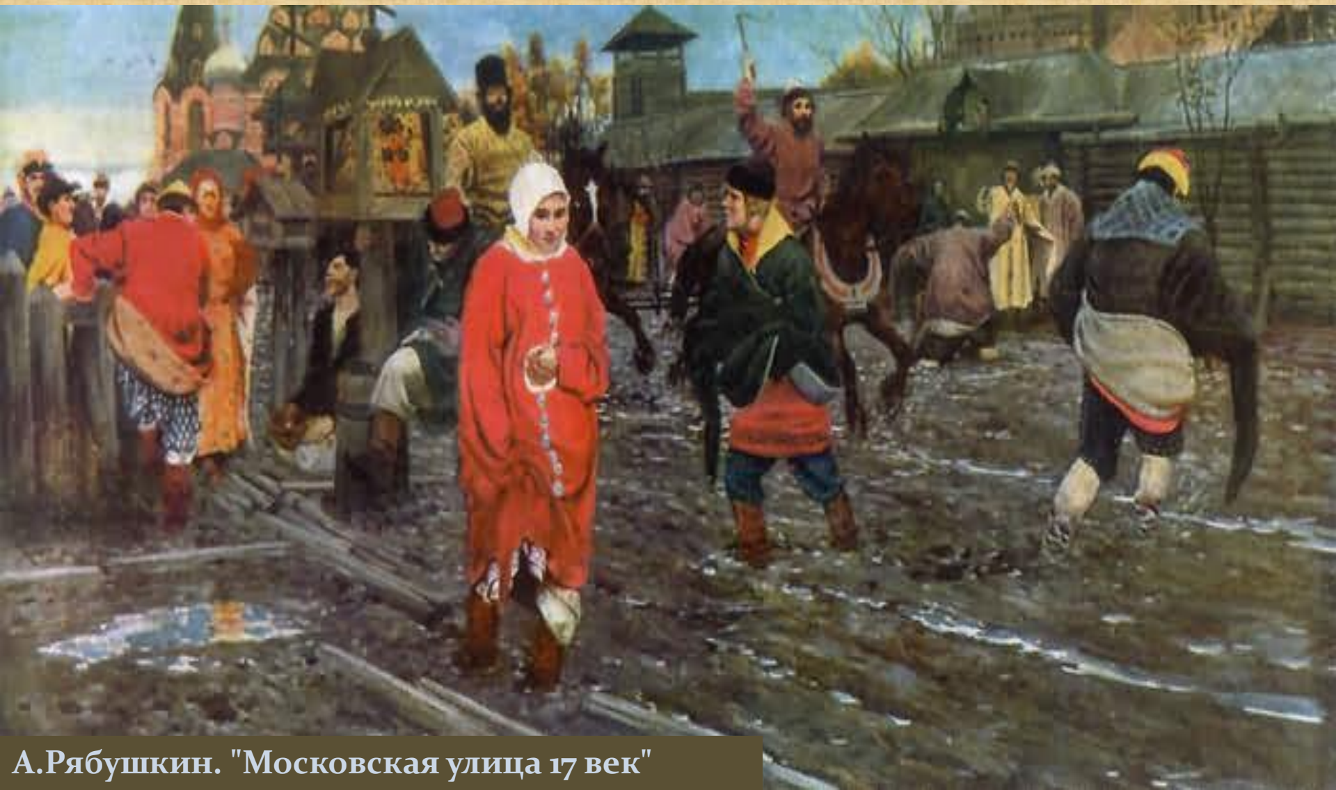
А.Рябушкин. "Московская улица 17 век"