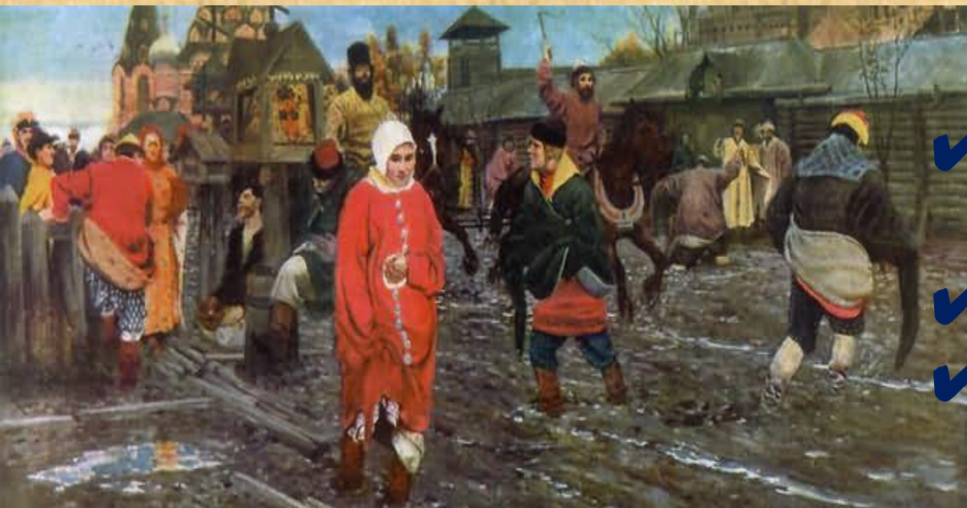
А.Рябушкин. "Московская улица 17 век"