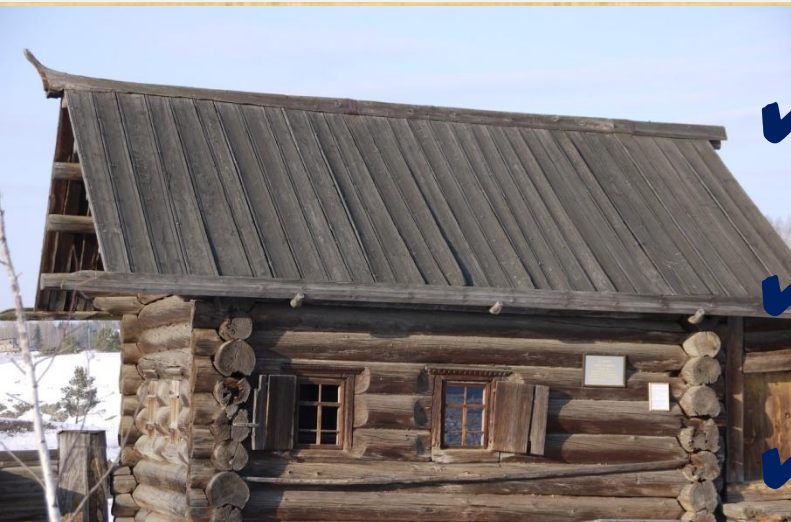
Крестьянская изба 17 века.