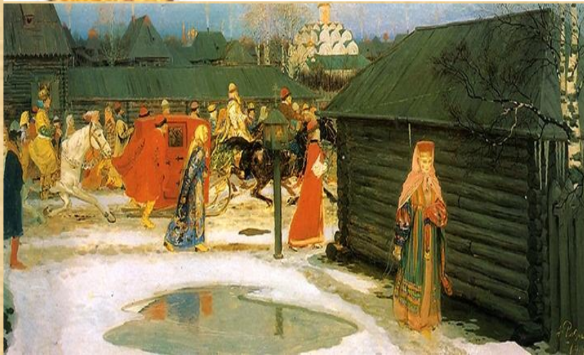
А.Рябушкин «Московская девушка» (17 век)