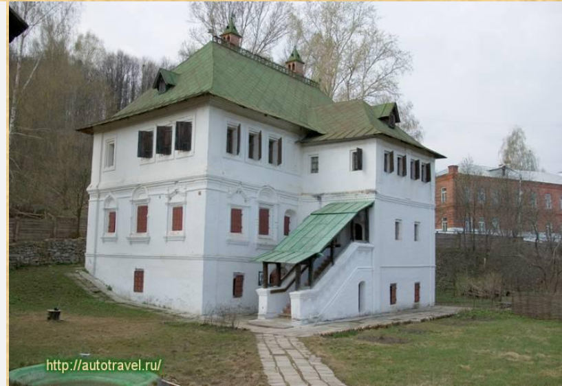
Купеческий дом 17 века в Гороховце