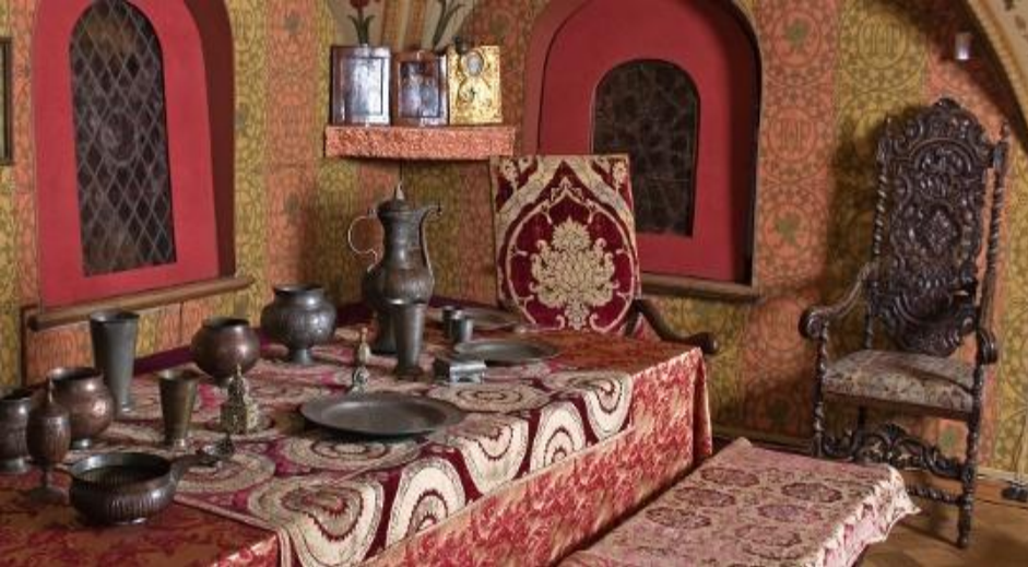
Бояре и дворяне