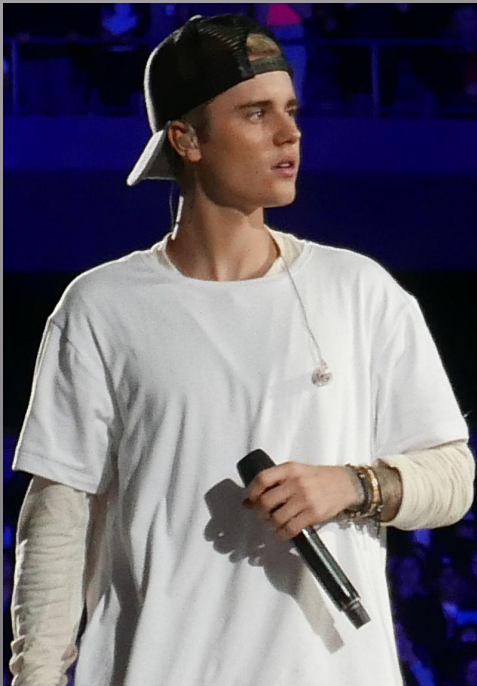
Фото в акаунті Джастіна Бібера в інстаграмі отримало найбільше лайків за всю історію платформи — 3.8 млн.

У Туркменістані Instagram блокується двома місцевими мобільними операторами.