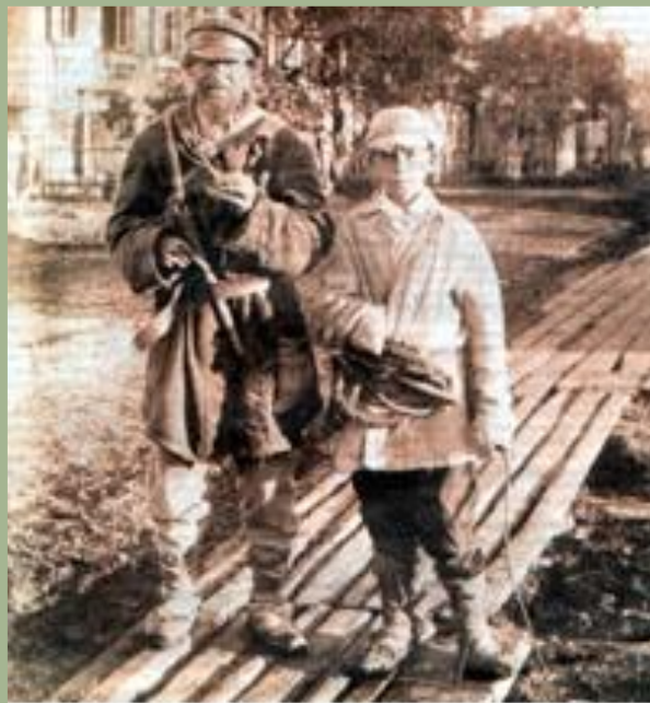
Крестьяне в городе. Конец XIX-начало XX вв.

Первые 10 лет после реформы промышленность переживала спад производства, приспосабливаясь к организации производства в новых условиях.