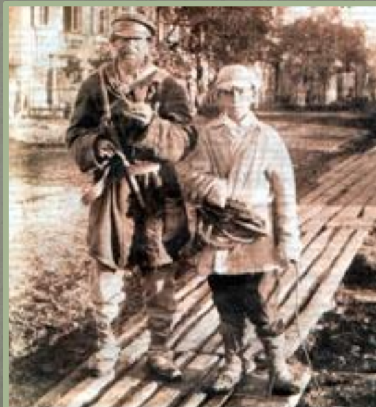
Крестьяне в городе. Конец XIX-начало XX вв.

Основой сельского хозяйства после реформы оставались помещичьи и крестьянские хозяйства. В первые годы после реформы в сельском хозяйстве происходил спад производства. Почему?