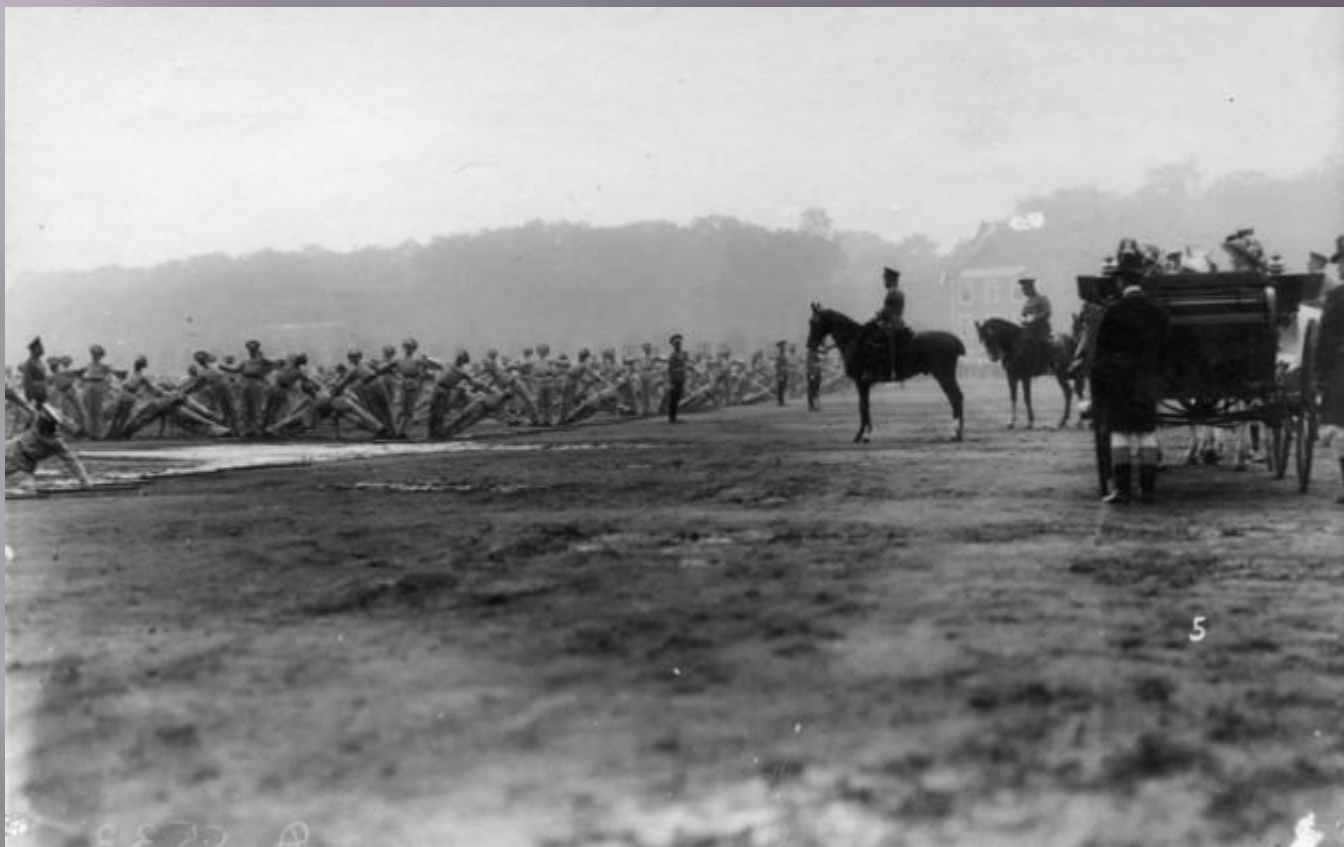
Молодежная организация «Потешные войска».