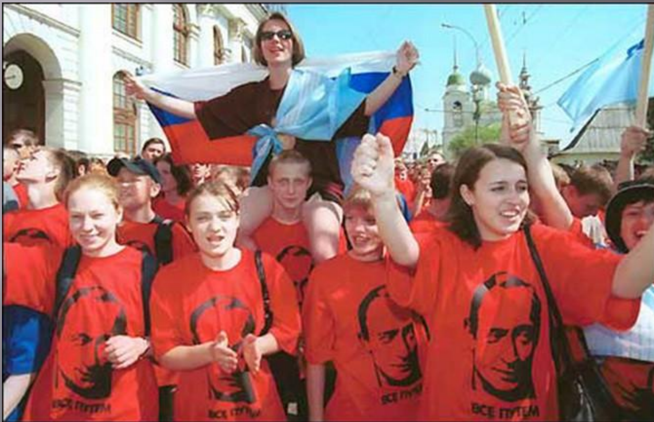
Движение «Идущие вместе».