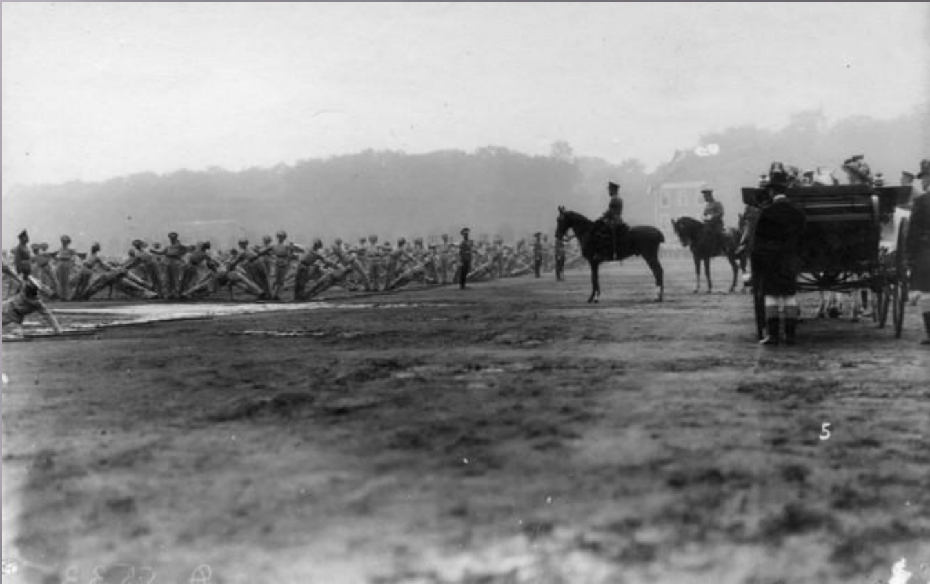
Молодежная организация «Потешные войска».