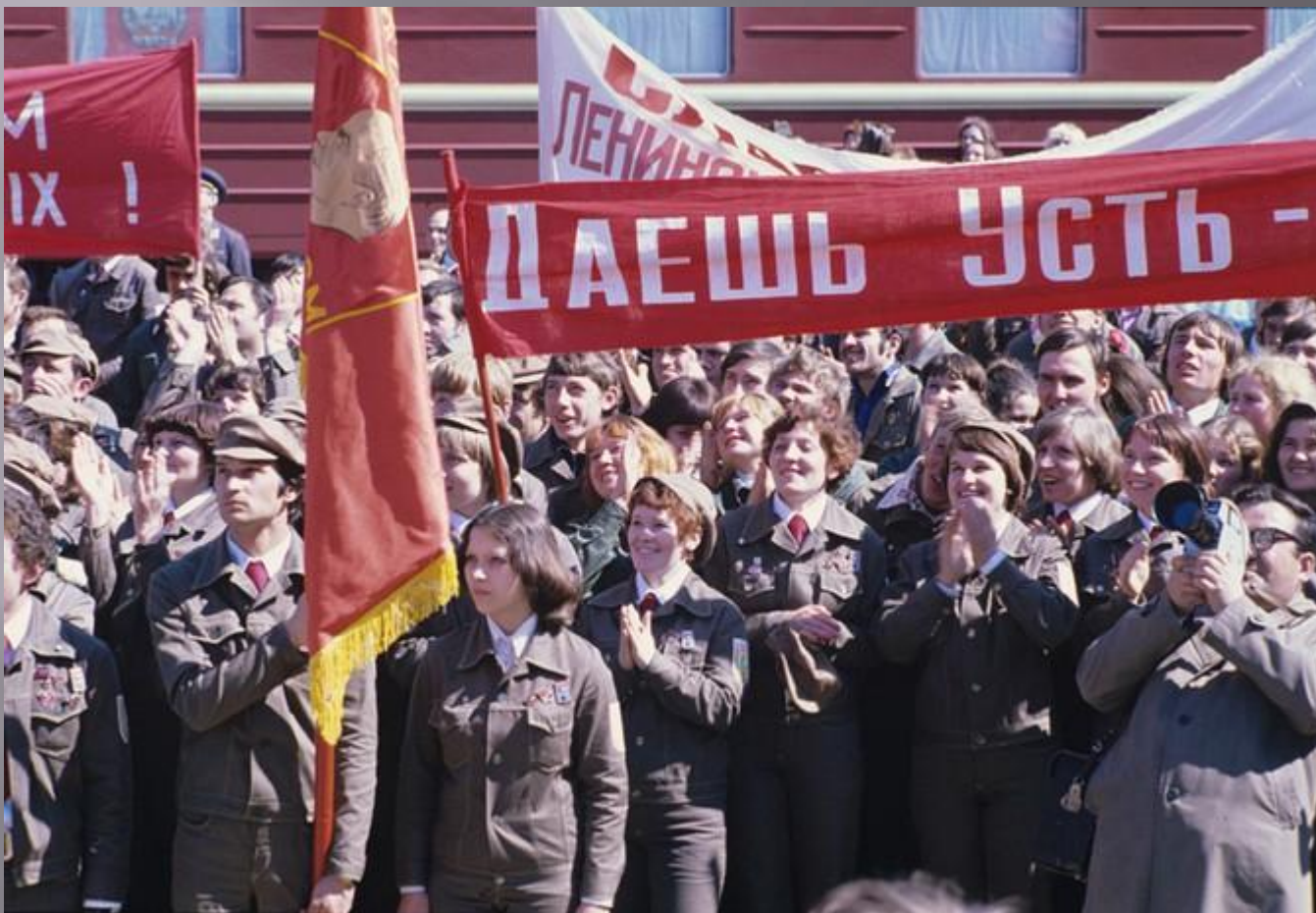
Всесоюзный ленинский коммунистический союз молодежи (ВЛКСМ).