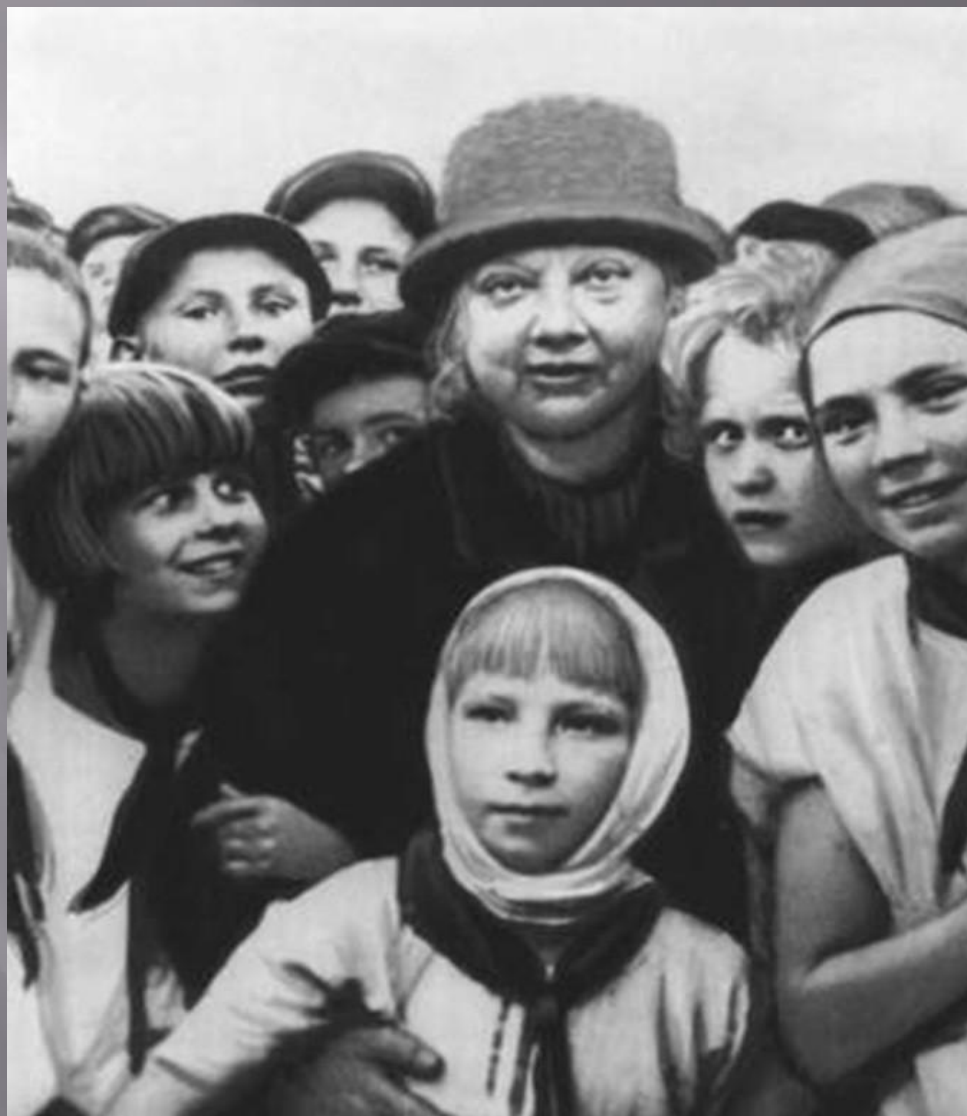
Всесоюзная пионерская организация имени В. И. Ленина.