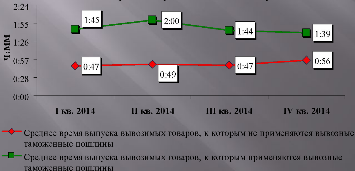
Сроки выпуска вывозимых товаров

среднее время выпуска вывозимых товаров, к которым применяются вывозные таможенные пошлины, составило 1 час 39 минут; среднее время выпуска вывозимых товаров, к которым не применяются вывозные таможенные пошлины, составило 56 минут.