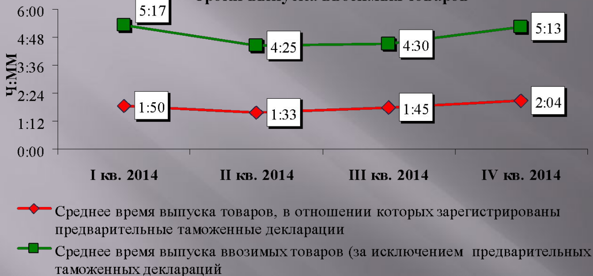
Сроки выпуска ввозимых товаров

В отношении ввозимых товаров, продекларированных с применением предварительного таможенного декларирования, среднее время выпуска составило 2 часа 4 минуты;