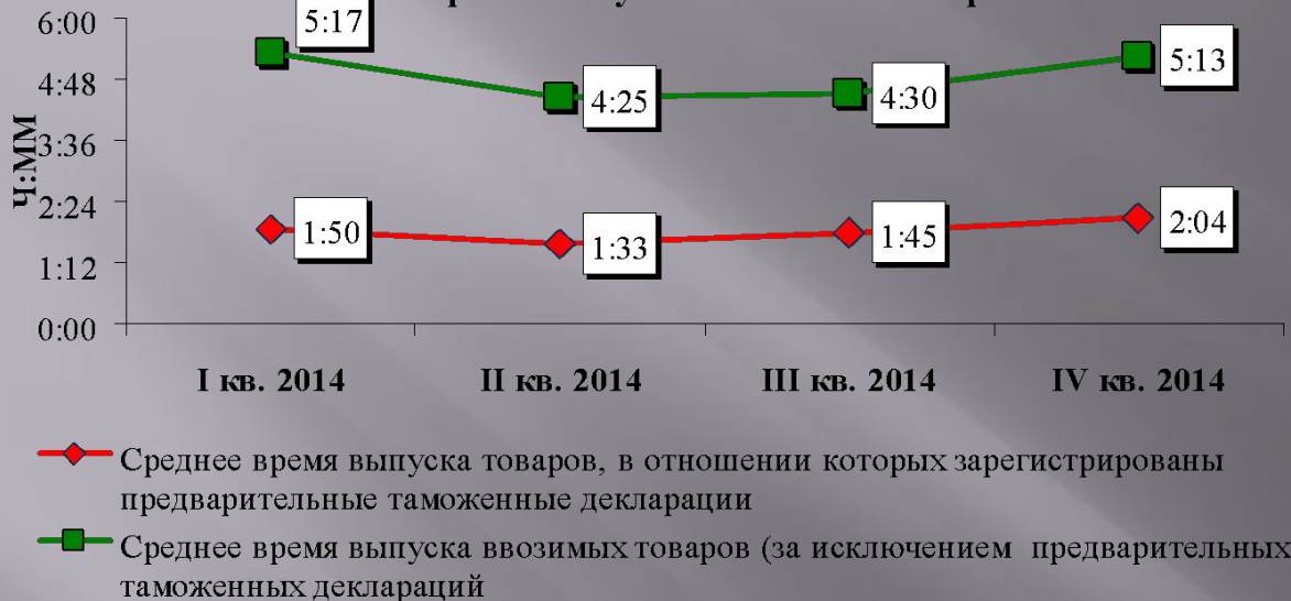
Сроки выпуска ввозимых товаров

В отношении ввозимых товаров, продекларированных с применением предварительного таможенного декларирования, среднее время выпуска составило 2 часа 4 минуты;