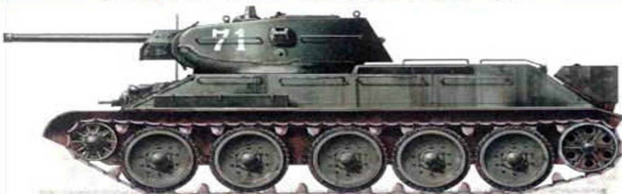
СРЕДНИЙ ТАНК Т-34-76 ОБРАЗЦА 1941 Г.