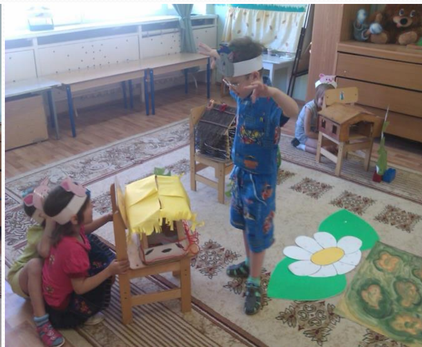
Сюжетно-ролевая игра «Три поросенка»