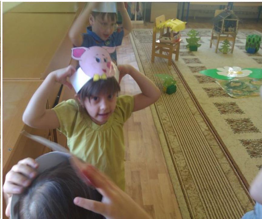
Сюжетно-ролевая игра «Три поросенка»