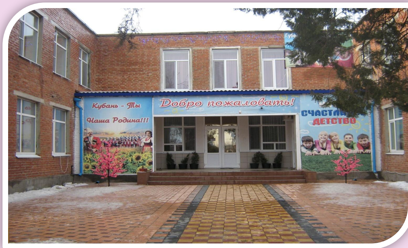
МУНИЦИПАЛЬНОЕ АВТОНОМНОЕ ДОШКОЛЬНОЕ ОБРАЗОВАТЕЛЬНОЕ УЧРЕЖДЕНИЕ «ДЕТСКИЙ САД №8» ДИНСКОЙ РАЙОН, СТ. ДИНСКАЯ, УЛ. КРАСНОАРМЕЙСКАЯ – 72 «А»