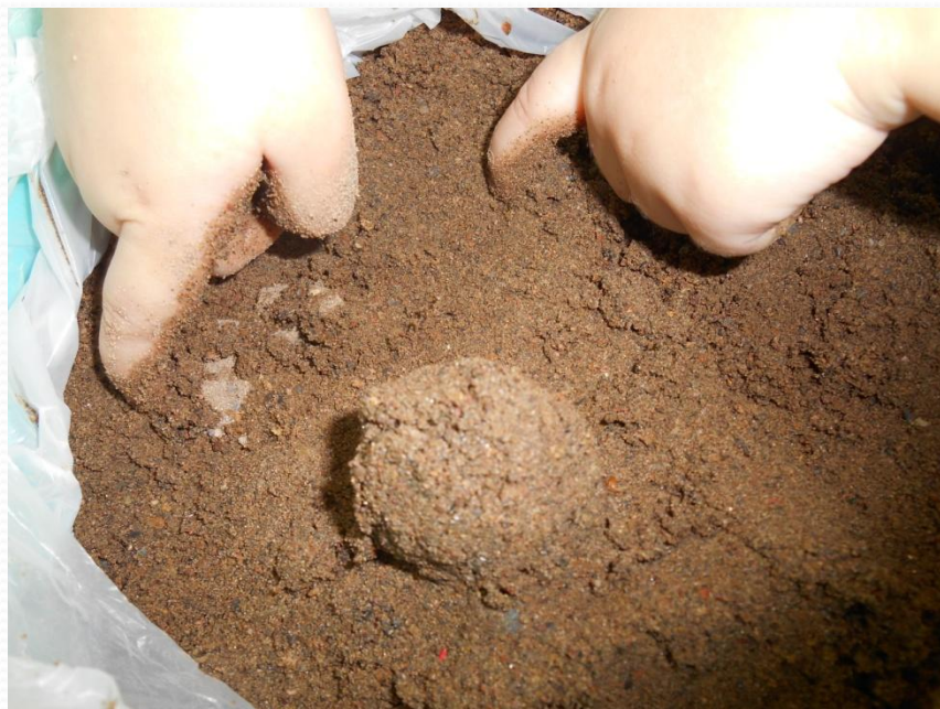
Игра с мокрым песком