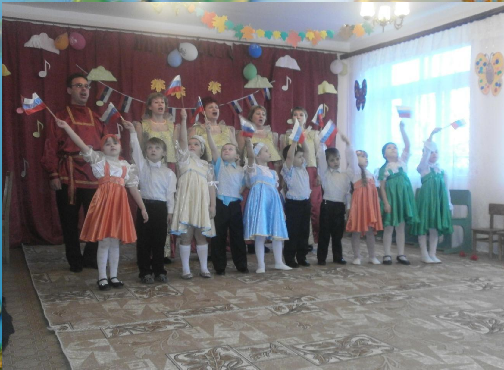
Праздник « Славься Русь – Отчизна моя», проведённый совместно с коллективом сельского Дома Культуры