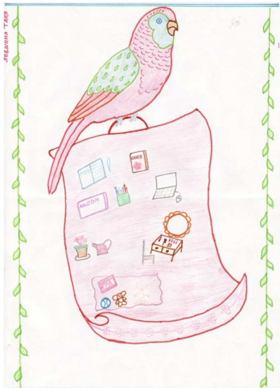
Герб семьи Левшиной Тани