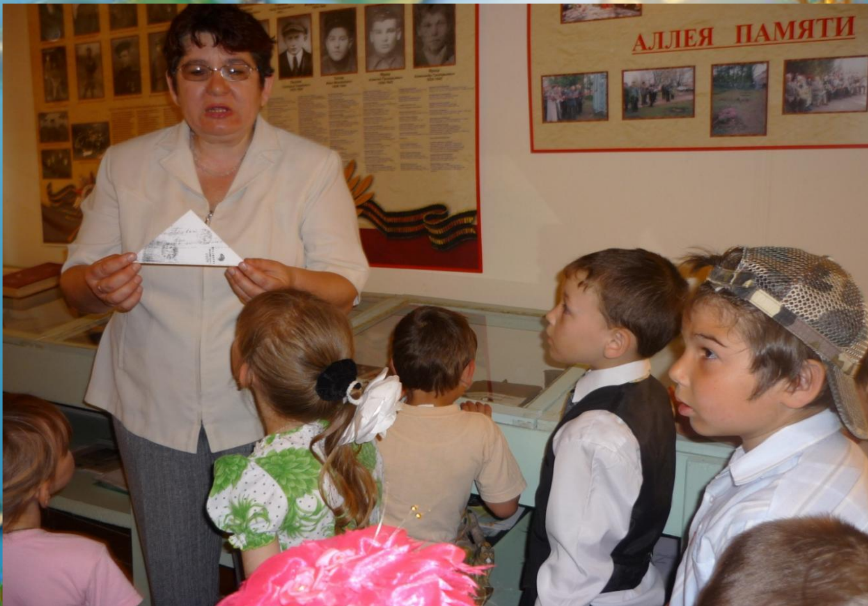
В музейной комнате СОШ п. Петровский