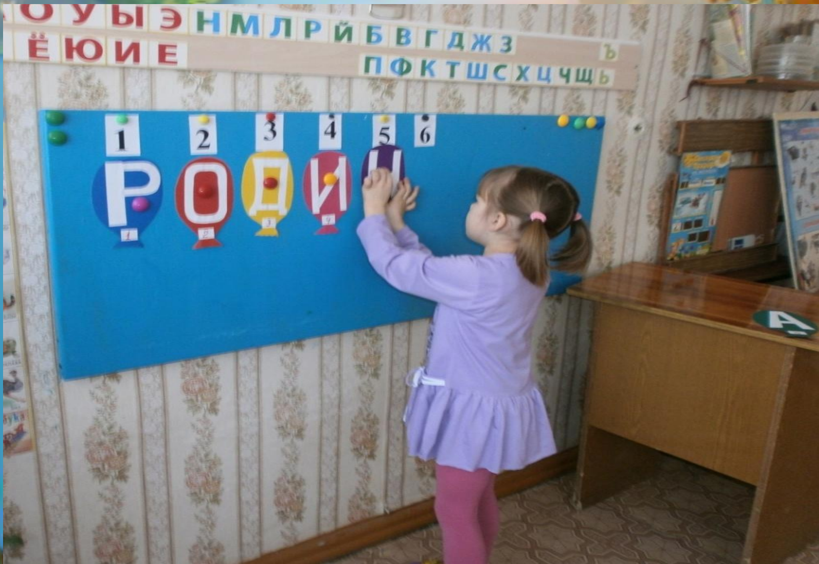
Дидактическая игра «Составь слово»