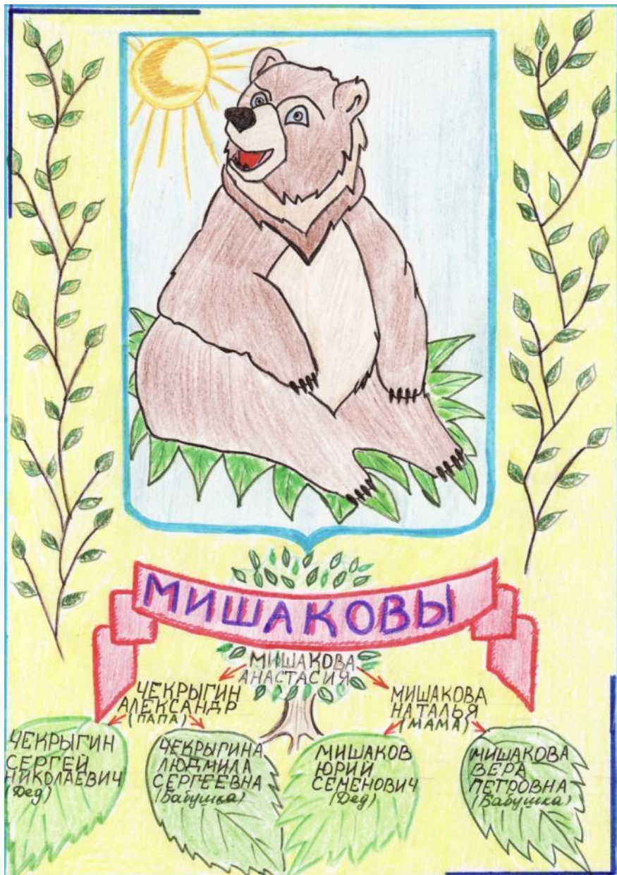
Герб семьи Мишаковой Насти