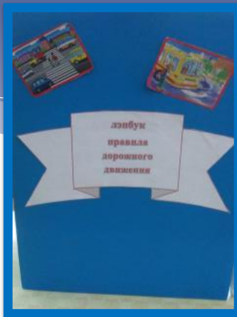
Лепбук «Правила дорожного движения»