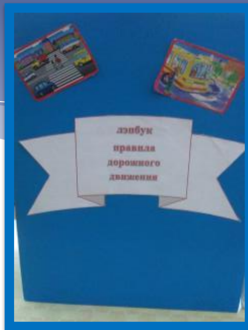
Лепбук «Правила дорожного движения»