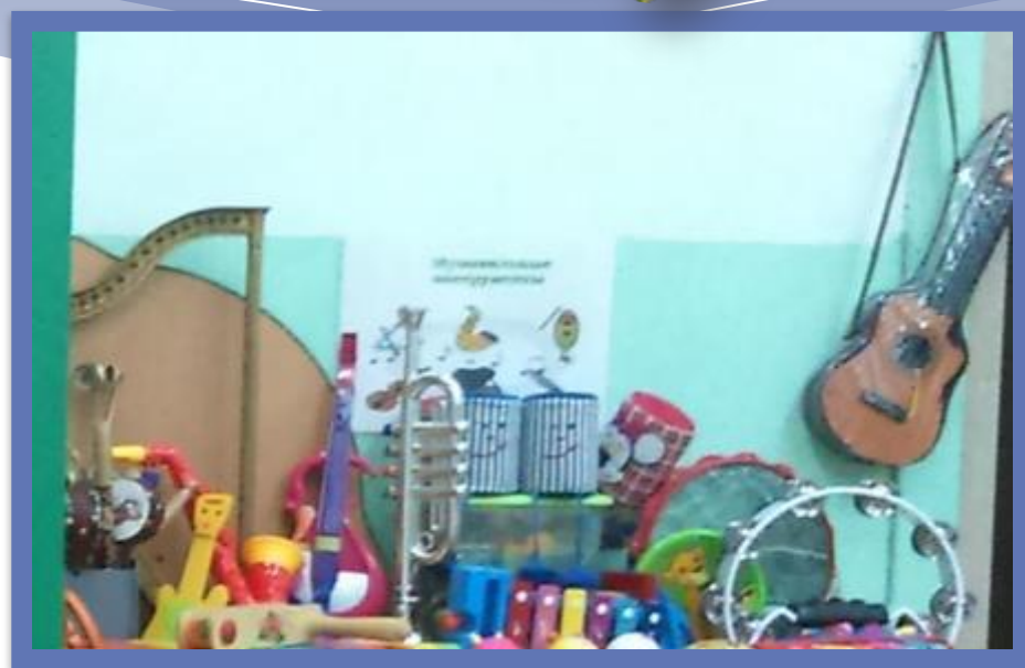
Центр Театра, и Музыки