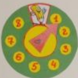
Сделай букву сам