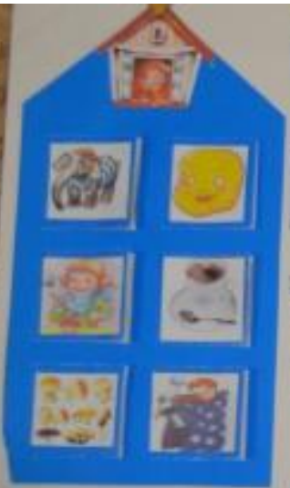
Рассели картинки по домам