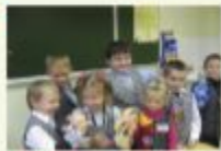
Плюсы, созданные букашки