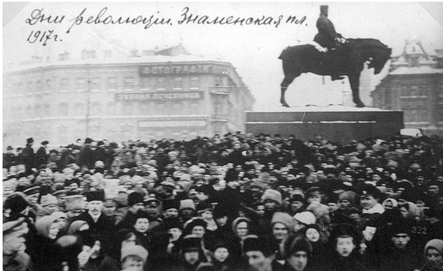
Знаменская площадь. 1917 г.