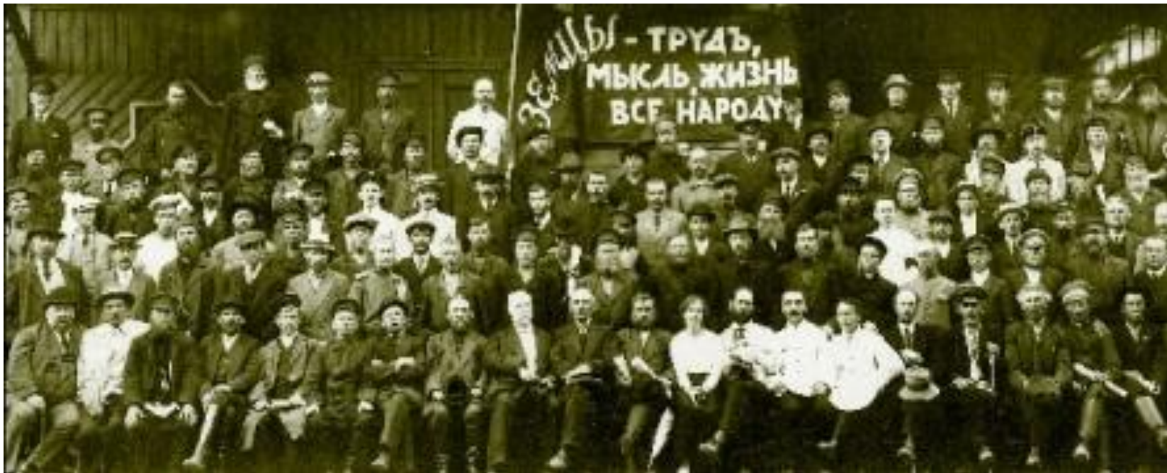
Земства Олонецкой губернии. 1917г.