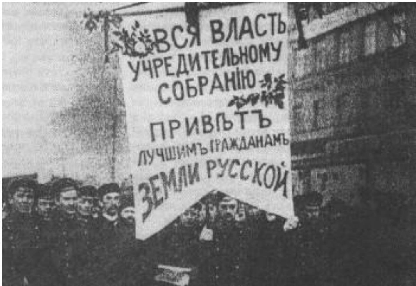
Петроград. 5 января 1918 г.