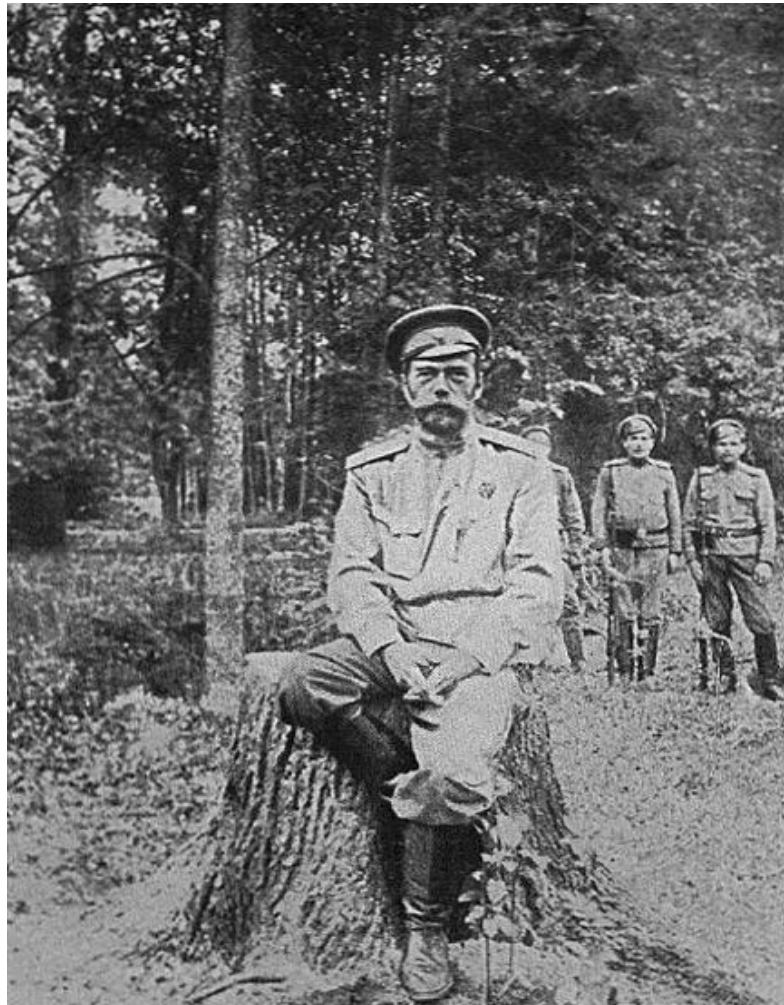
Царское село. Март 1917 г.