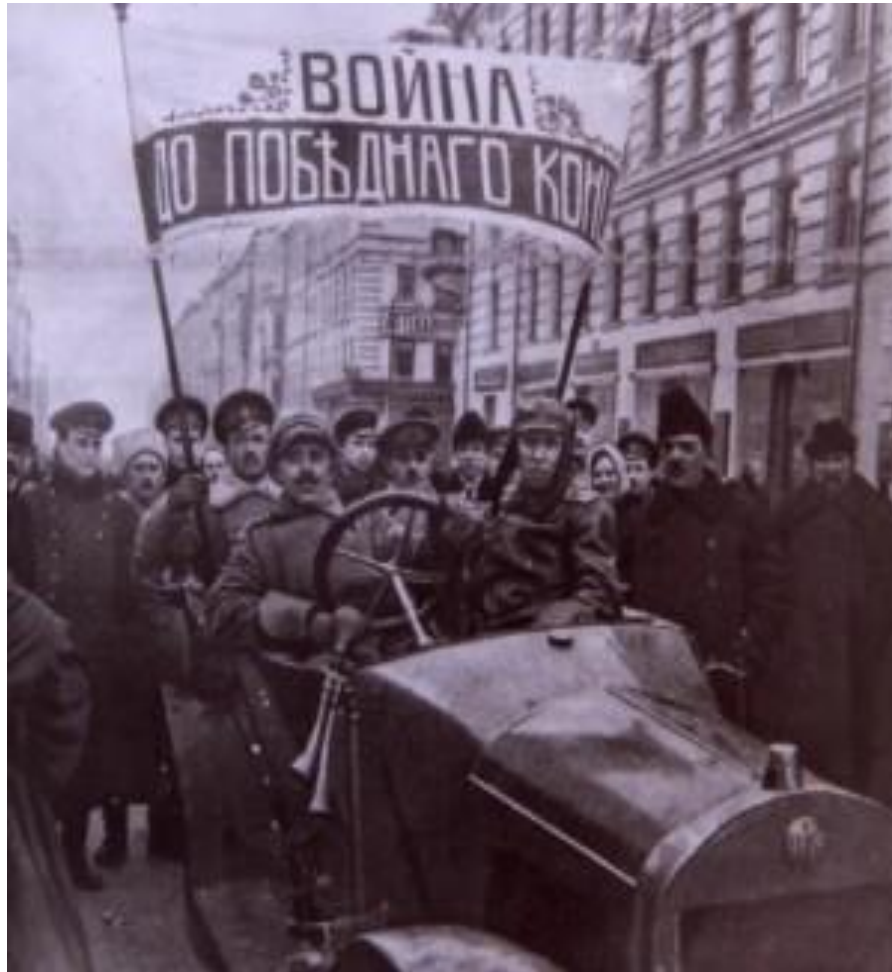
Москва. 1917 г.