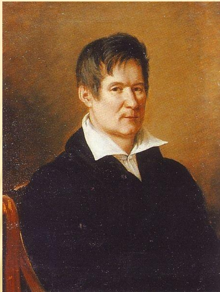
□ В. П. Стасов