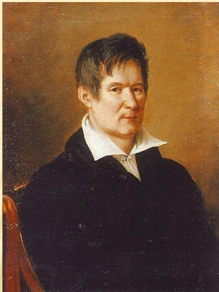
□ В. П. Стасов