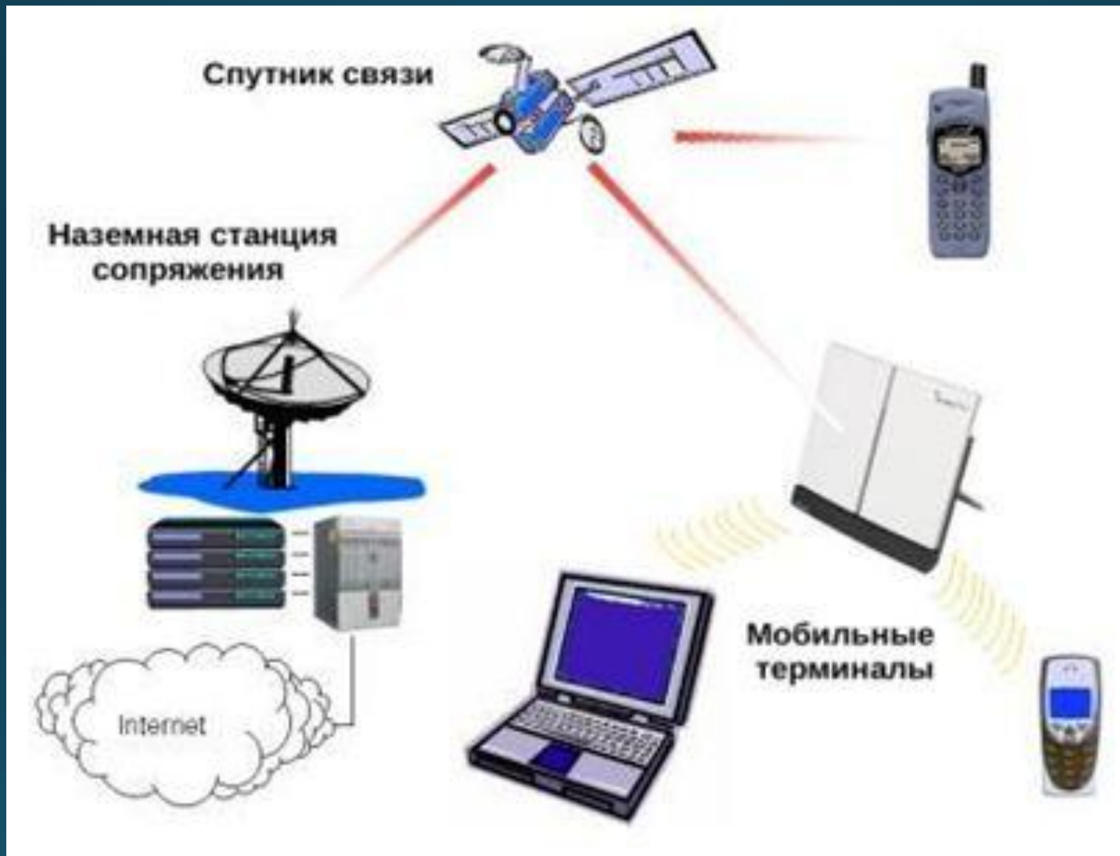
Типовая схема организации сети спутниковой мобильной связи