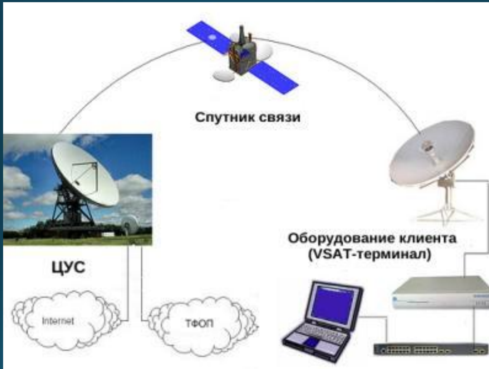
Схема организации спутниковой сети VSAT