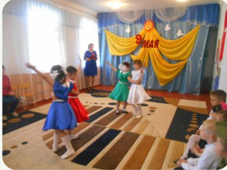
АКЦИЯ «ГОЛУБЬ мира».