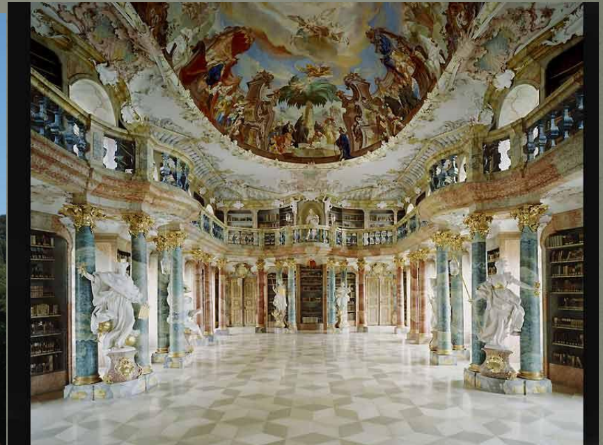
Аббатство Адмонт, Австрия Старейший бенедиктинский монастырь Штирии