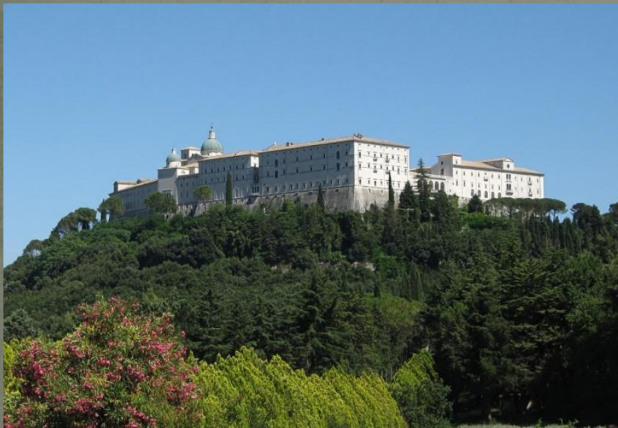
Монастырь Монте-Кассино, Италия