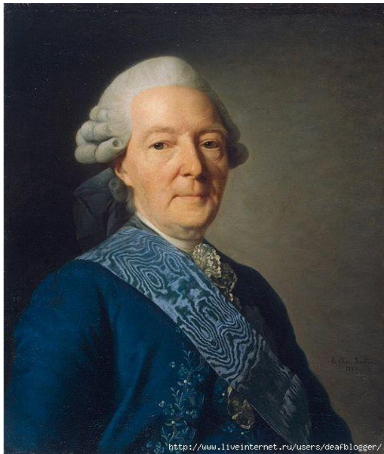
Иван Иванович Бецкой