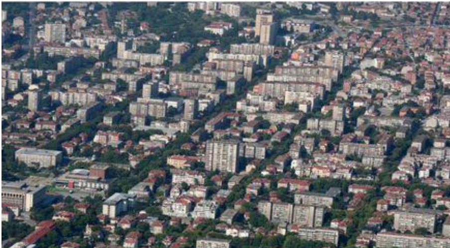
Фото: Болгария, г. Стара-Загора