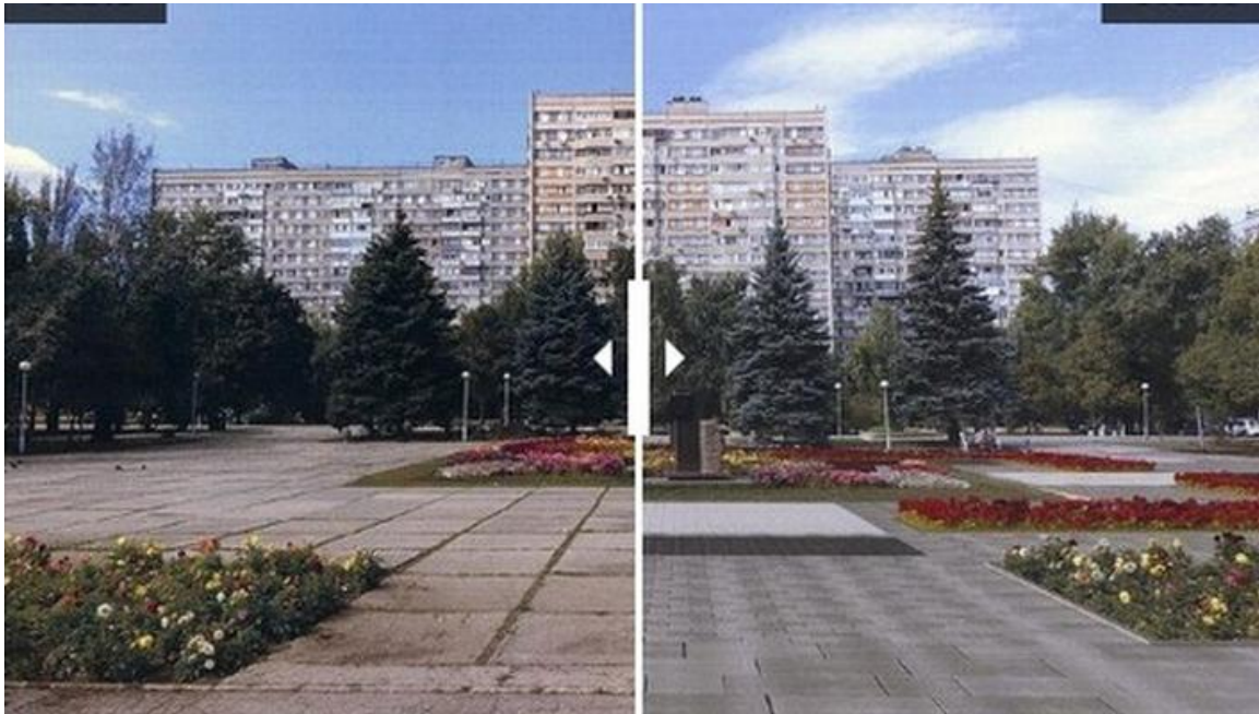
Комплексное архитектурно-художественное решение территории прилегающей к зданию кинотеатра «Шипка» по ул. Стара-Загора

В Самаре в 2016 году в честь 50-летнего юбилея улицы Стара-Загора запланирована масштабная реконструкция бульвара. Работы начались уже этой весной. Здесь появились малые архитектурные формы и новая плитка. Отремонтировали дорожное покрытие и тротуары. Вдоль всей проезжей части разбили клумбы и обновили газоны. Благоустроили аллею, расположенную между зданием бывшего кинотеатра "Шипка" и улицей Ново-Вокзальной, и отреставрировали старый фонтан. На кольце Стара-Загоры - проспекта Кирова будет установлен памятный знак, посвященный советско-болгарской дружбе. Власти обещают провести реконструкцию кинотеатра "Шипка" и убрать все незаконные торговые точки рядом с ним.