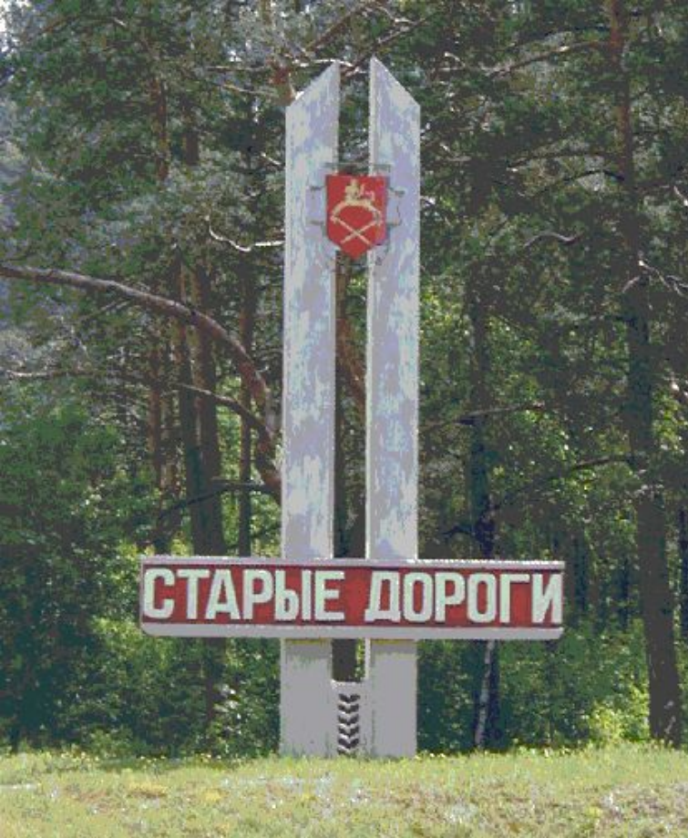
Въездной знак города