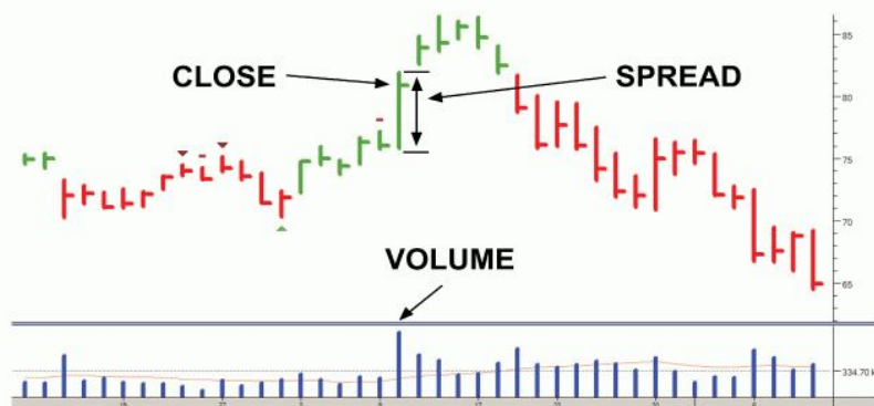
FIGURE 1: Components of Volume Spread Analysis

Особая форма учебной деятельности включает элементы анализа, исследования в общем контексте некоторой уже осознанной либо осознаваемой как необходимости профессиональной направленности, личностного самоопределения.