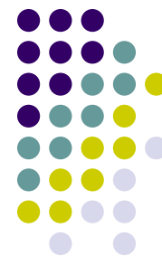
Схема счета производства