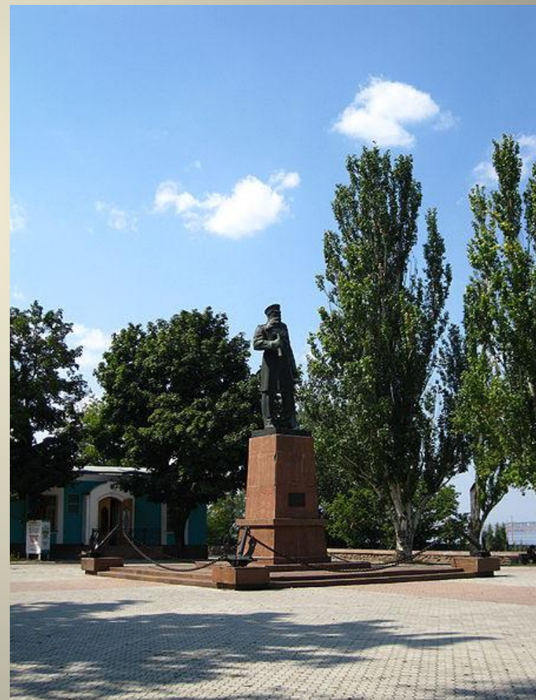
Памятник С. О. Макарову (Кронштадт)