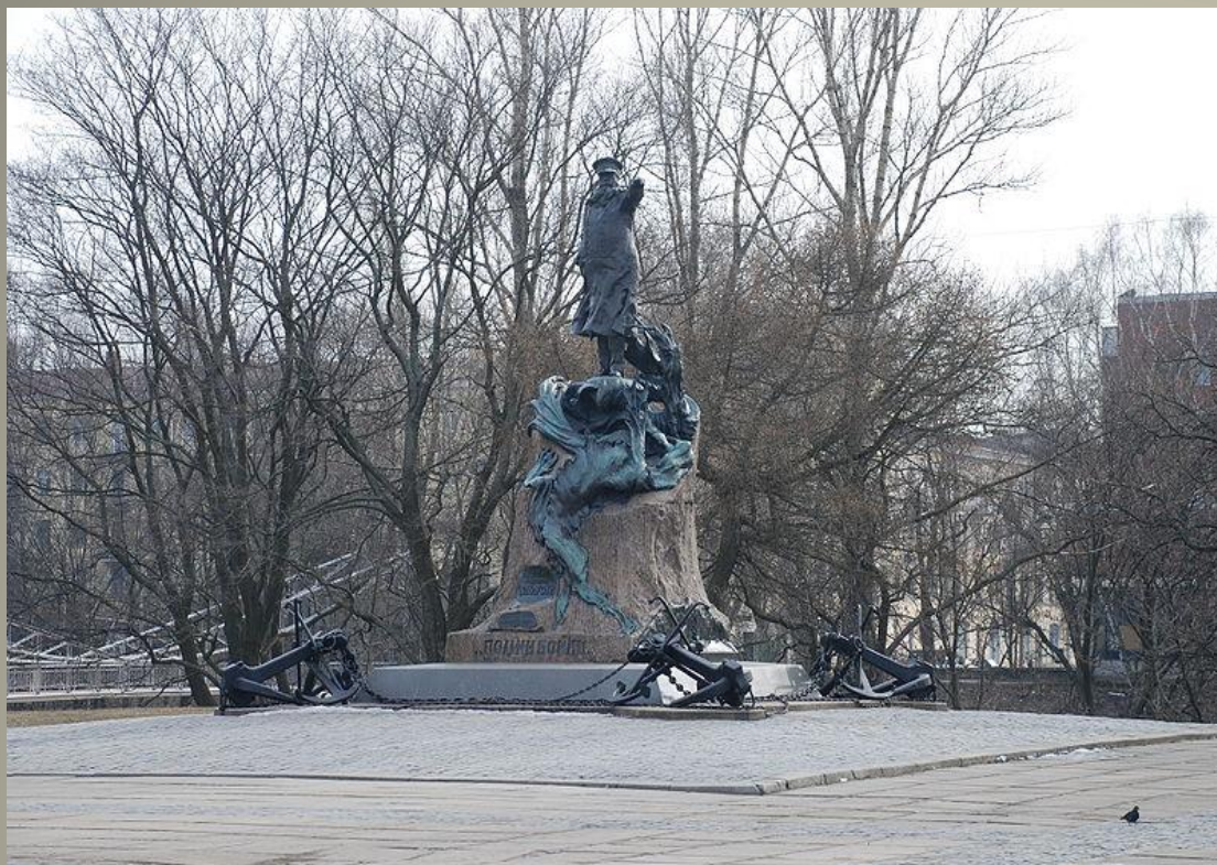
Памятник С. О. Макарову в Николаеве