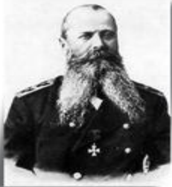
Степан Осипович Макаров (27 декабря 1845 (8 января 1849), Николаев — 31 марта (13 апреля) 1904, близ Порт-Артура)