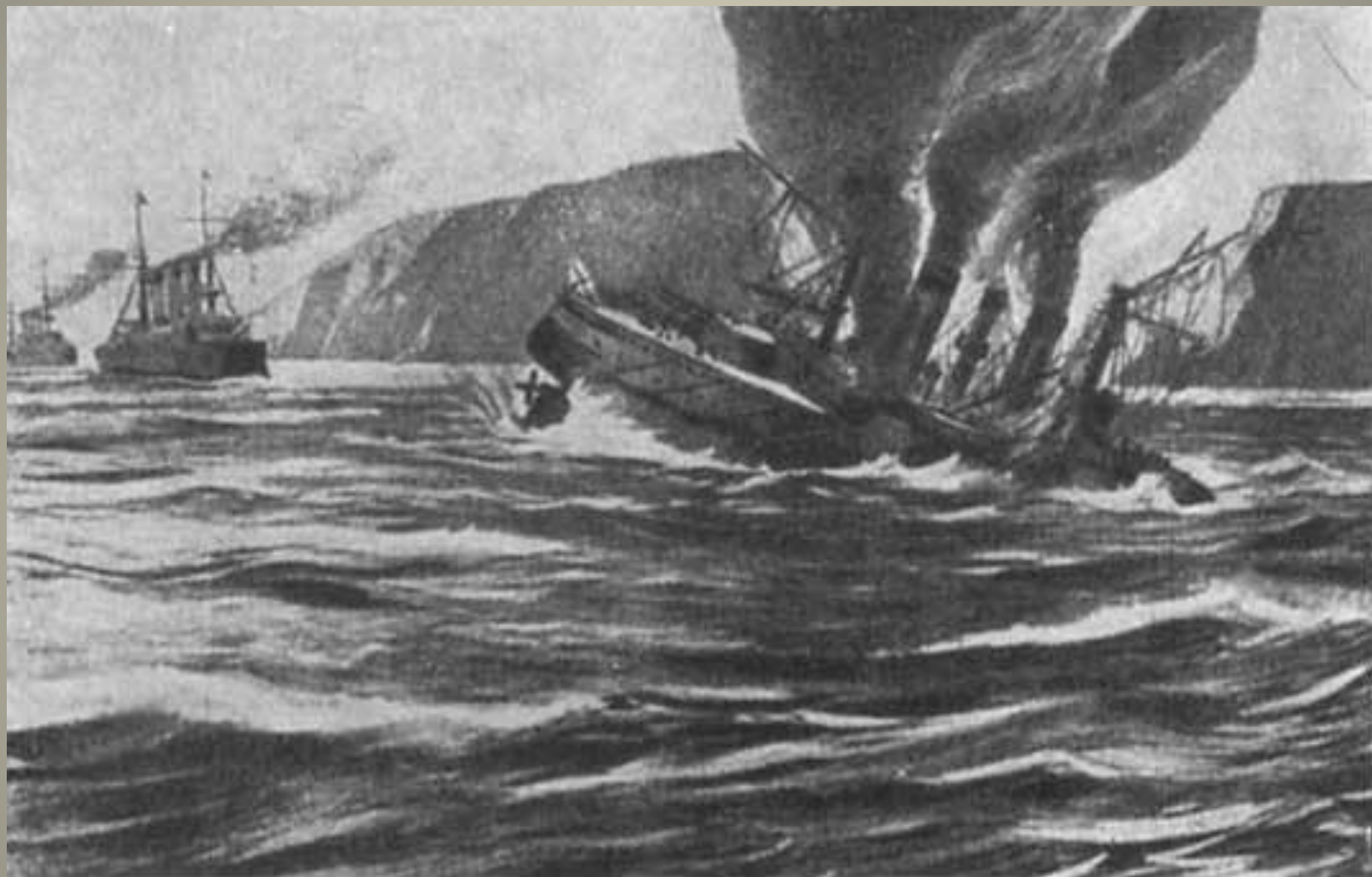
Гибель броненосца «Петропавловск». С рисунка современника.