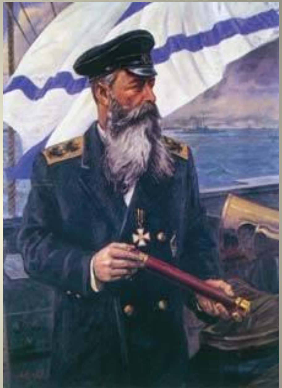
Кронштадт 1953 г.