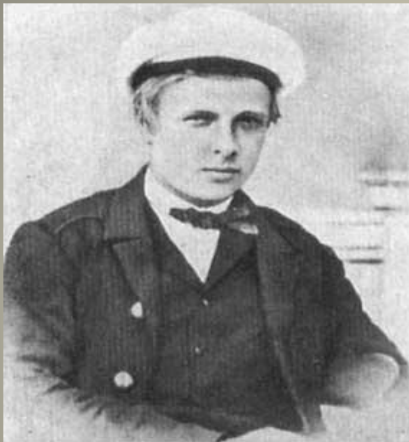
С. Макаров. 3 ноября 1866 года, корвет «Аскольд», Нагасаки, Япония.