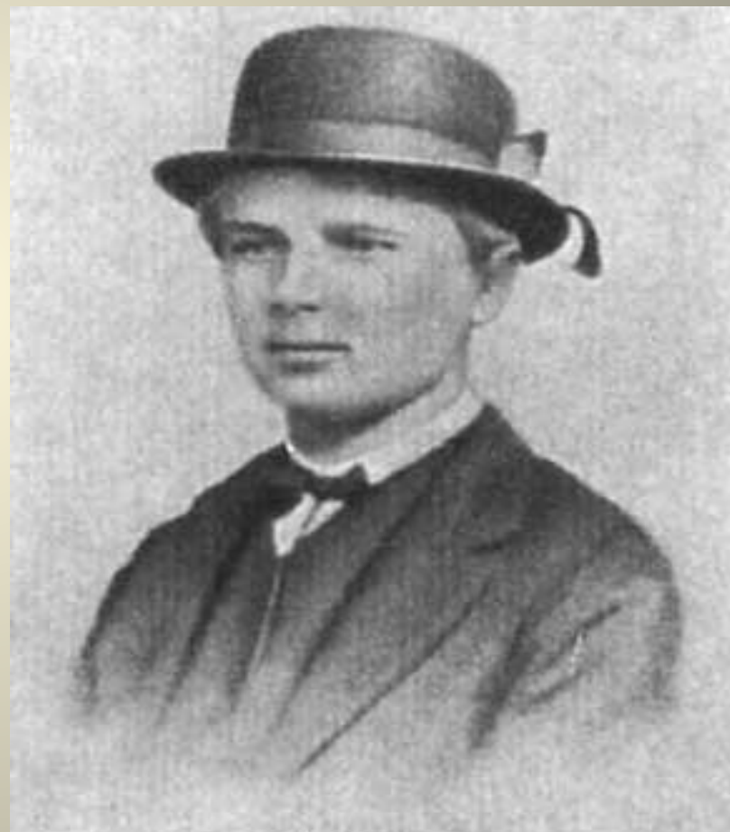
С.О. Макаров. Май 1867 г., корвет «Аскольд», рейд.