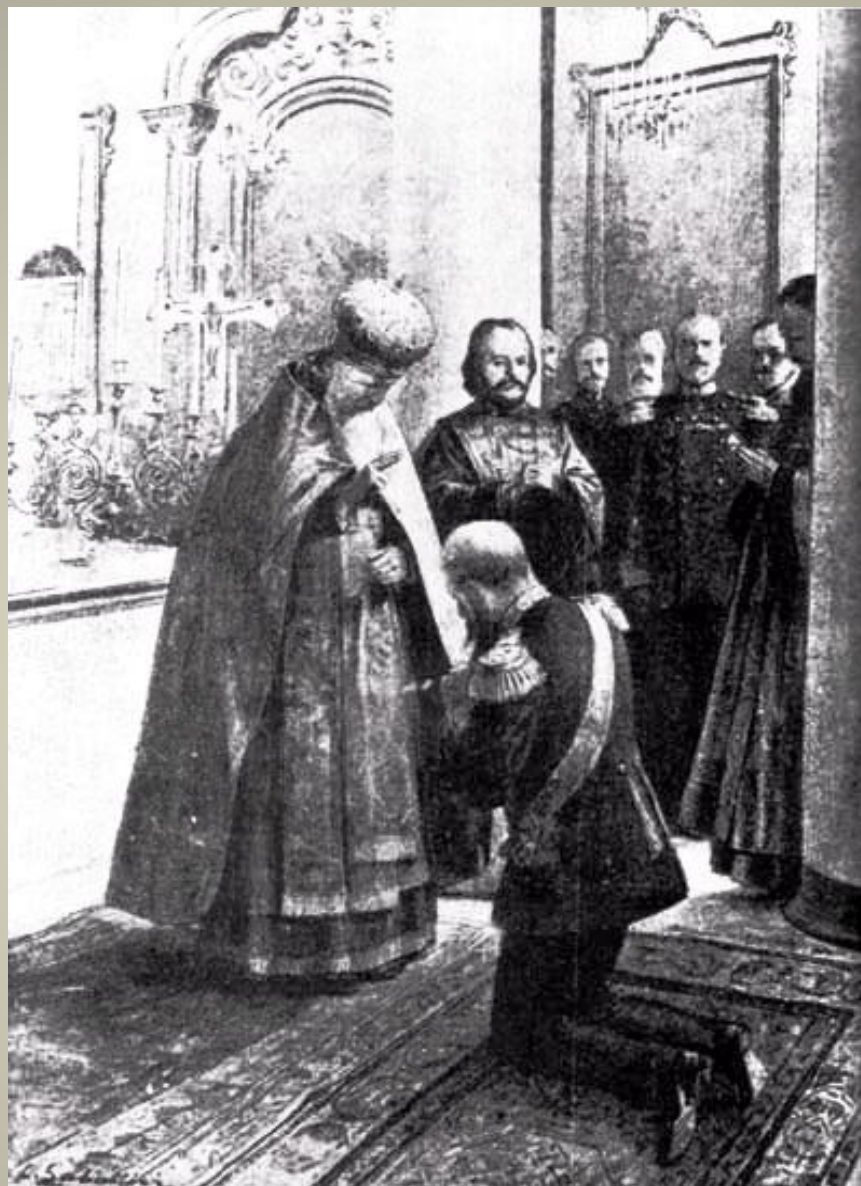
Иоанн Кронштадтский благословляет адмирала Макарова перед отъездом в Порт-Артур