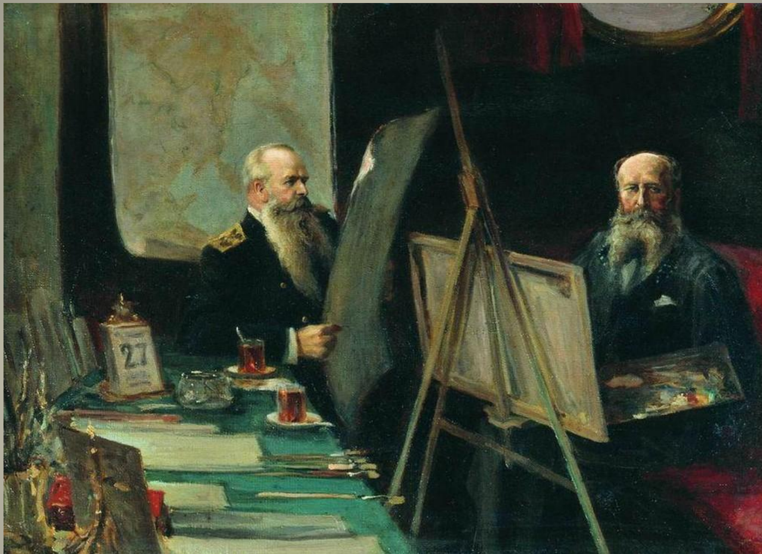
Картина художника Е.И Столица. Вице-адмирал С.О.Макаров и художник-баталист В.В.Верещагин в каюте броненосца «Петропавловск» в 1904 году.