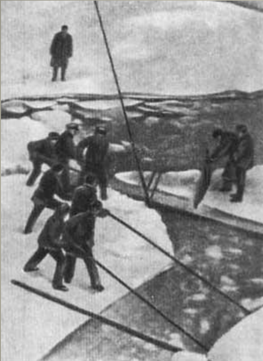
Экипаж «Ермака» берет пробу полярного льда на исследование. Вдали на льдине С. О. Макаров.