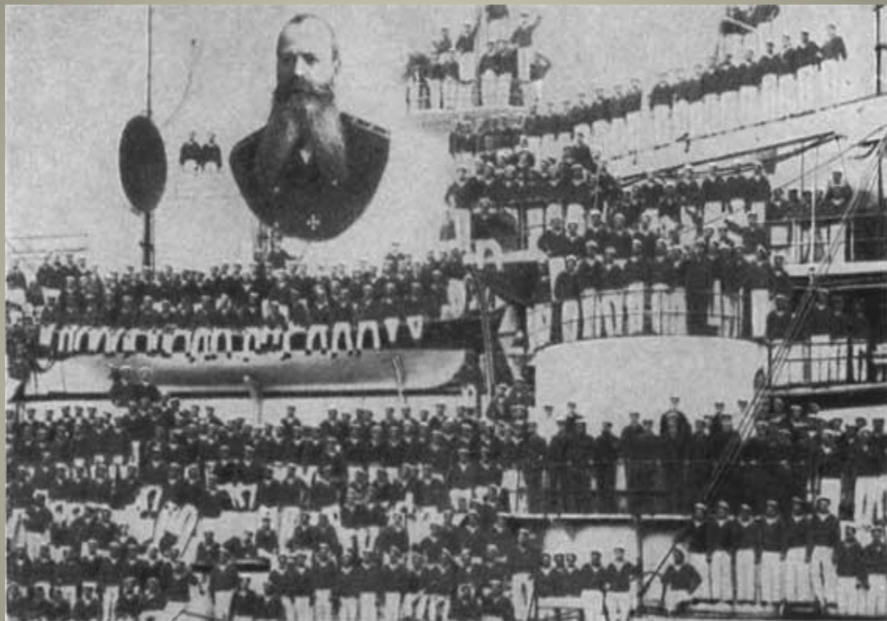
Команда броненосца «Петропавловск» (с открытки 1904 года).