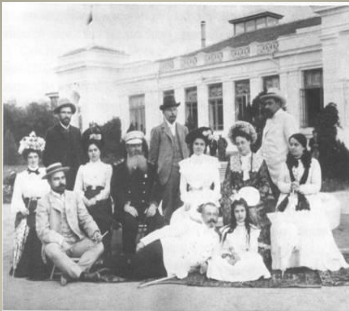
Адмирал С. О. Макаров с семьей и обслуживающим персоналом на фоне водолечебницы. 1902 г.