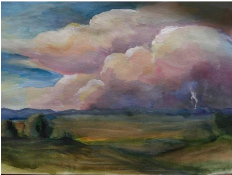
Иллюстрация «Как весел грохот летних бурь»