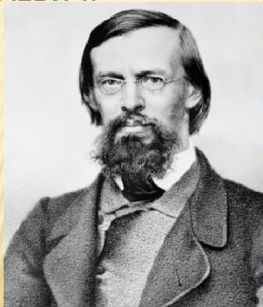
МАЙКОВ АПОЛЛОН НИКОЛАЕВИЧ.