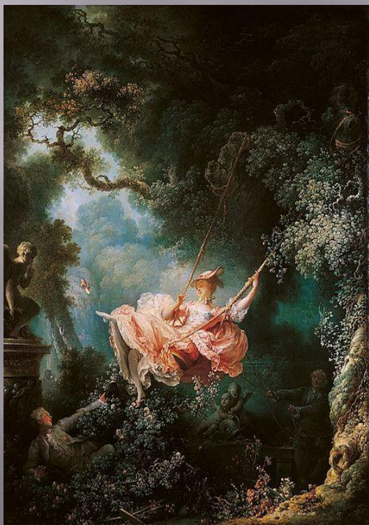
Фрагонар . «Качели» (1767)

Стиль рококо зародился во Франции и распространился в других странах: в Италии, Германии, России, Чехии и др. Это относится и к живописи, и к другим видам искусства