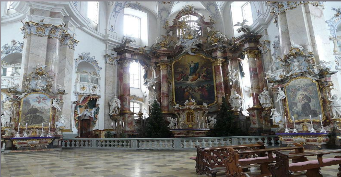
Баварское рококо: Базлика Фирценхайлиген.

Их капители искажаются кокетливыми изменениями и прибавками, карнизы помещаются над карнизами; высокие пилястры и огромные кариатиды подпирают ничтожные выступы с сильно выдающимся вперёд карнизом; крыши опоясываются по краю балюстрадами с флаконо-видными балясинами и с помещёнными на некотором расстоянии друг от друга постаментами, на которых расставлены вазы или статуи; фронтоны , представляя ломающиеся выпуклые и впалые линии, увенчиваются также вазами, пирамидами, скульптурными фигурами, трофеями и другими подобными предметами.