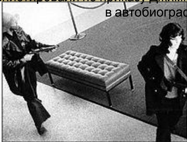
FEDERAL BUREAU OF INVESTIGATION

Адвокаты проиграли, и Хёрст была осуждена за грабёж. Через 22 месяца её амнистировали по приказу Джимми Картера. Патрисия издала книгу о событиях в автобиографической книге «Every Second Counts».