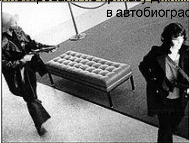
FEDERAL BUREAU OF INVESTIGATION

Адвокаты проиграли, и Хёрст была осуждена за грабёж. Через 22 месяца её амнистировали по приказу Джимми Картера. Патрисия издала книгу о событиях в автобиографической книге «Every Second Counts».